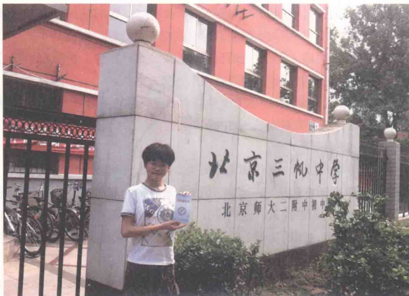
在三帆中学门口和录取通知书合影