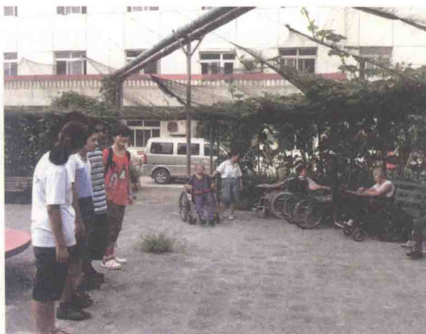
给坐在轮椅上的老人们唱歌