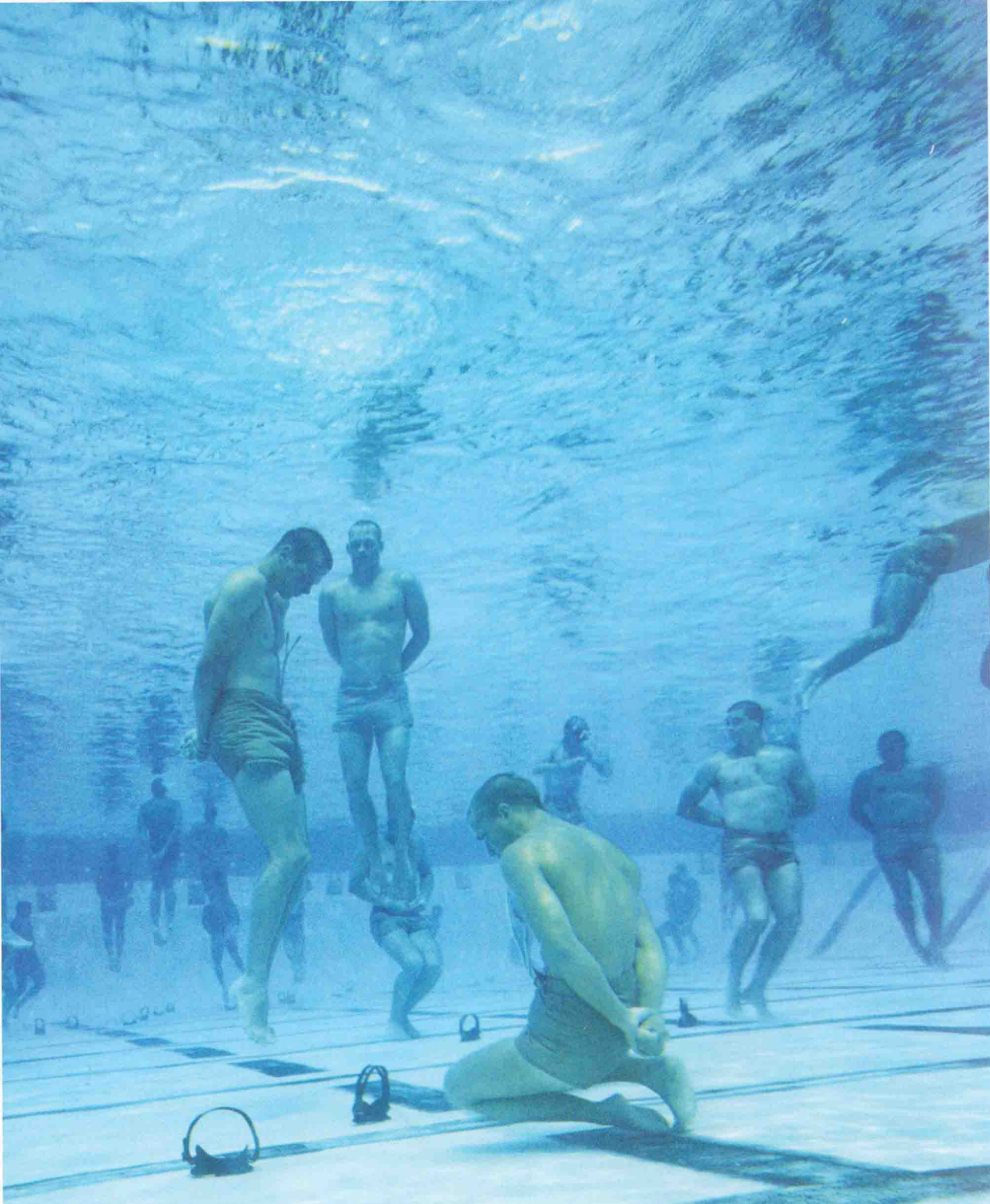
海豹突击队队员无疑要接受大量的水中训练。在越南战争中，海豹突击队开发出一种防止溺水的训练课程，以使受训者有信心在深水中生存。通过训练，受训者能够在水下舒适、自信地从事工作。在训练中，他们沉到水池底部，整张脸被水淹没，双手则被绑在身后，他们要找到水底的面罩，并用牙齿咬住面罩将其带到水面。