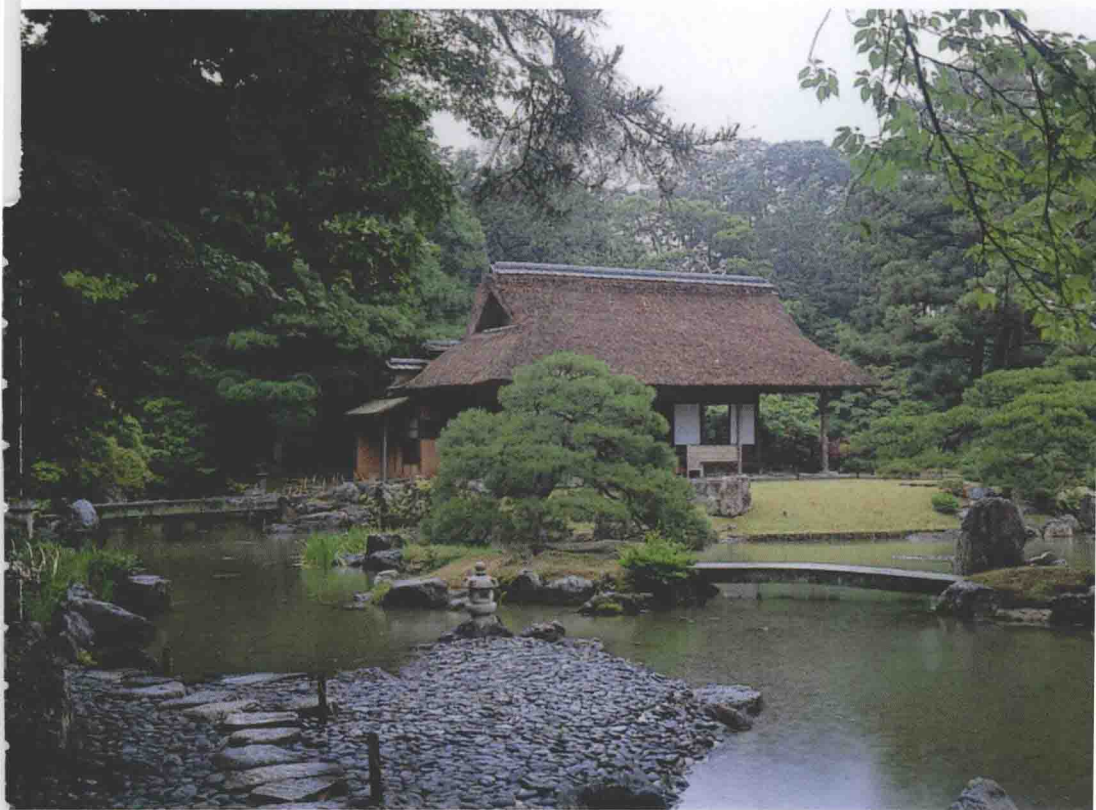
桂离宫 洲滨（前景）、天桥立（中景）、松琴亭景色 （参阅第七章）