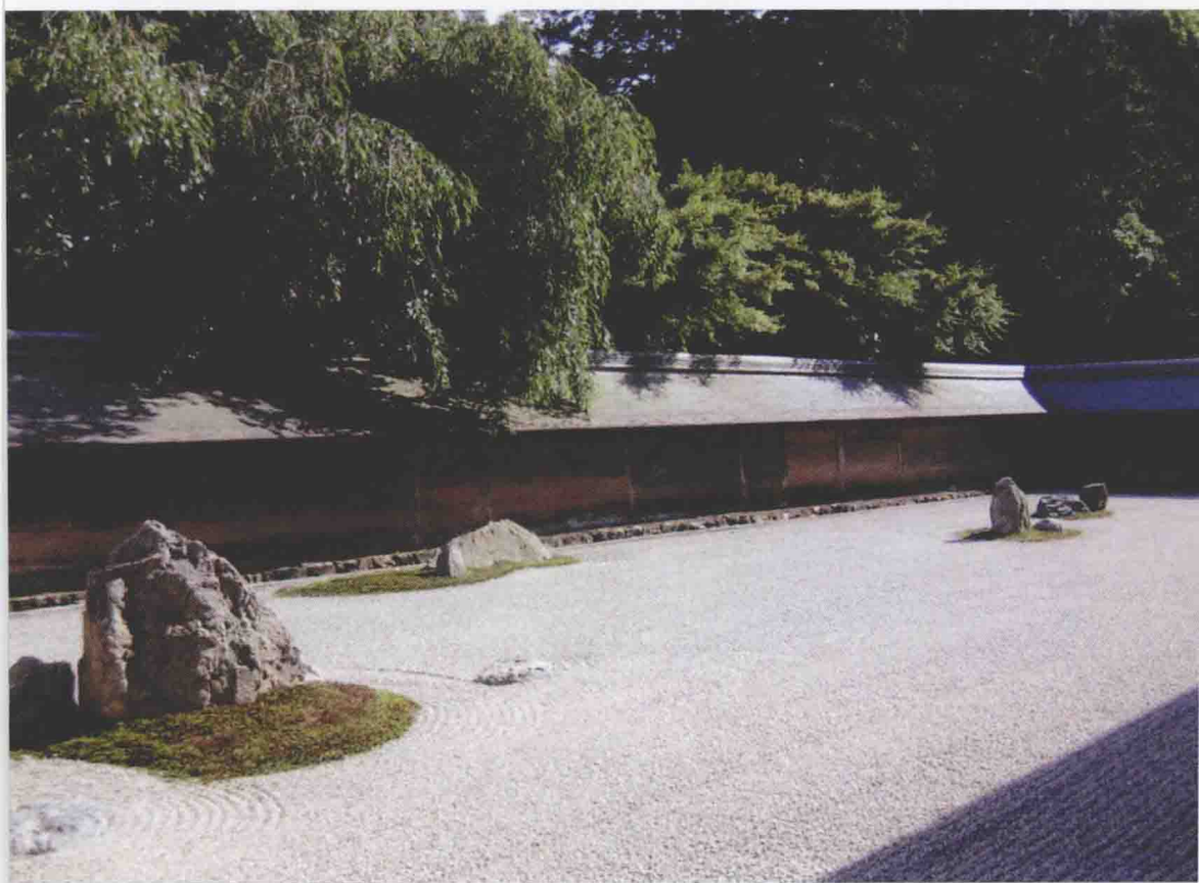
龙安寺 自东北面所见石庭全景 (参阅第五章)