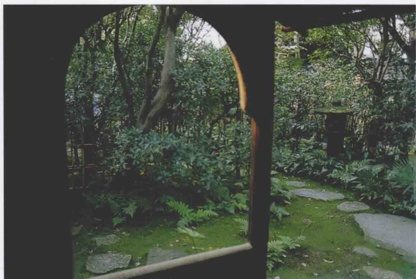
燕庵 自坐凳所见踏脚石和石灯笼 (参阅第六章)