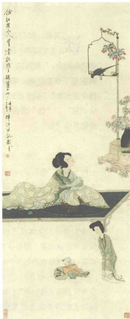
仿新罗山人笔意 [清] 钱慧安

楚人崇尚巫术，故屈原《楚辞》多涉神怪水鬼。这恰恰与楚文化是紧密相连的。烟雾缭绕与火燎驱邪，具有同样的功效。