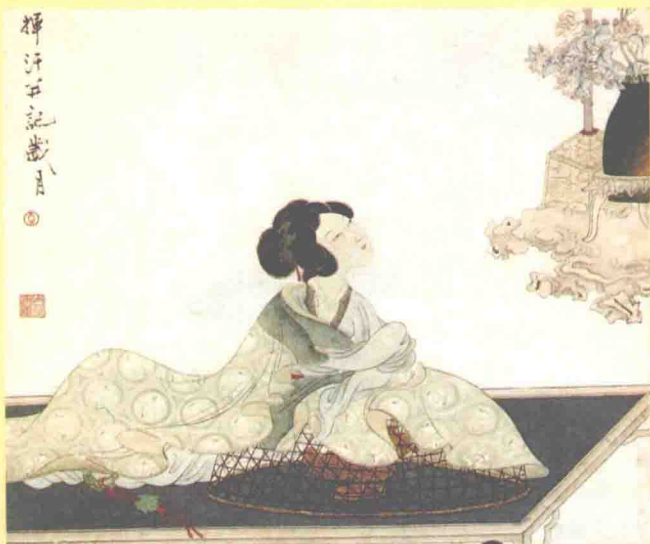
仿新罗山人笔意 [清] 钱慧安 (局部)

香，不仅是人类嗅觉的一种感官感受，更是人类一种美好的文化感受。“香”与人类文明和文化有着千丝万缕的联系，陪伴着中华文明走过了数千年的风雨兴衰，飘散在上下五千年的每处角落，不绝如缕，丝丝入内。“香道”就是这样在这种文明与文化的熏染下渐渐形成的。