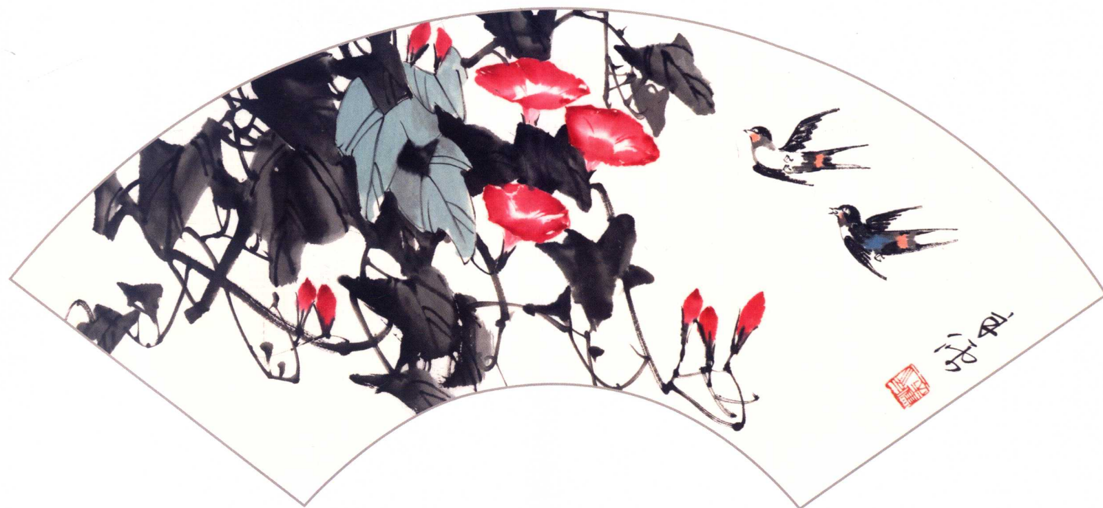
上 春燕去还来 下 燕歌牵牛