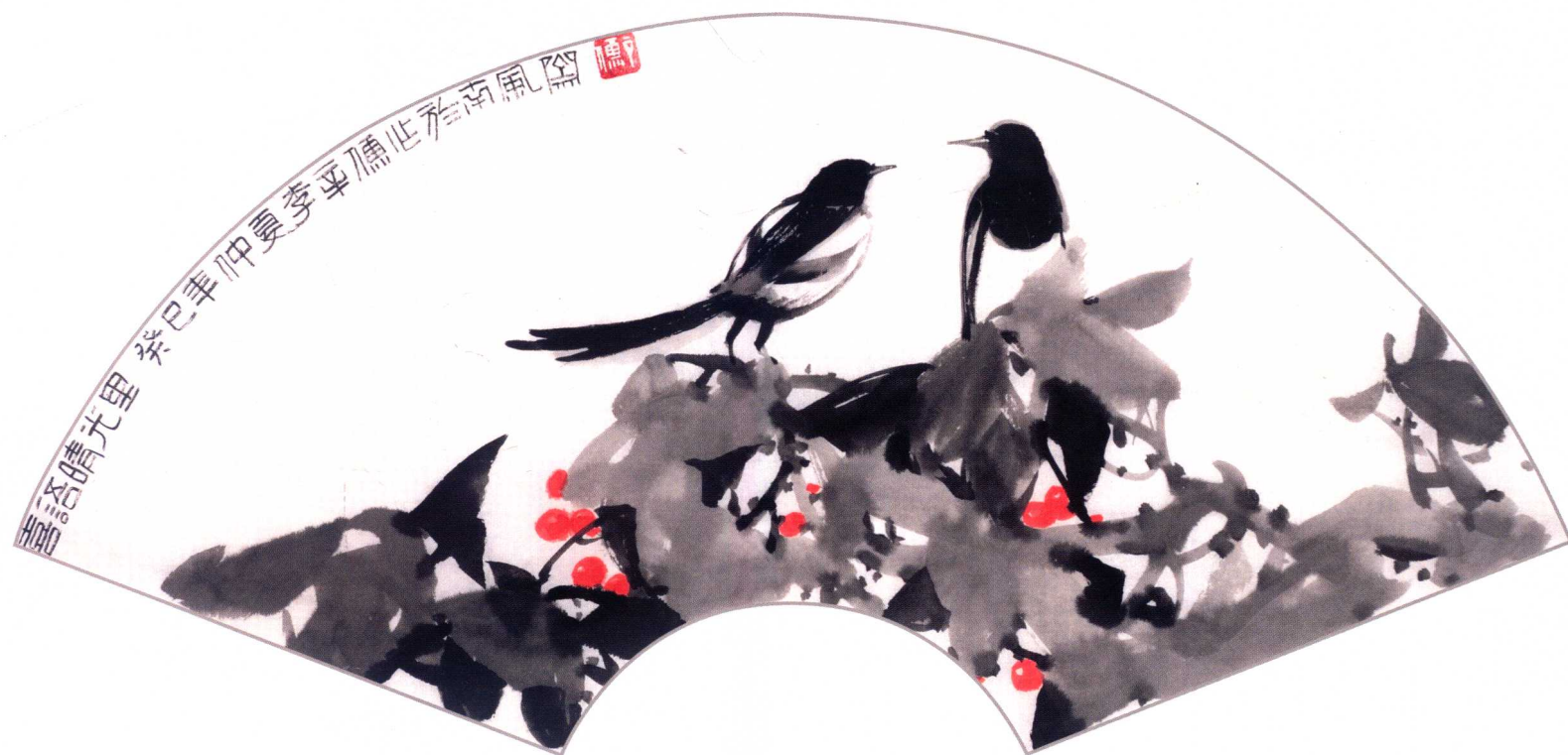
上 小園吾所好 下 喜語晴光里