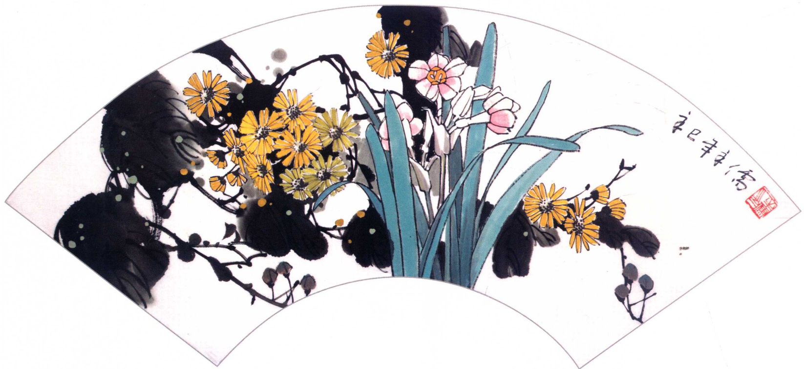
上 水仙花 下 水仙野菊