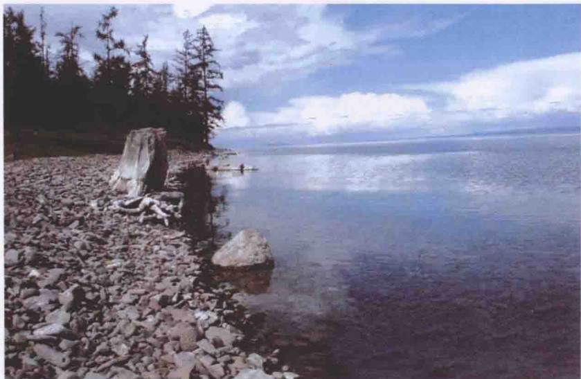
📍 贝加尔湖即当年的北海，是苏武牧羊的苦寒之地。

十九年，世事变迁，苏武终于得回长安。当年的英俊青年此时已须发皆白，当年随行的一百多人此时仅剩九人，只有那柄作为使臣信物的旌节，虽已旄毛落尽，却依然紧紧握在苏武手中，从不曾放开。