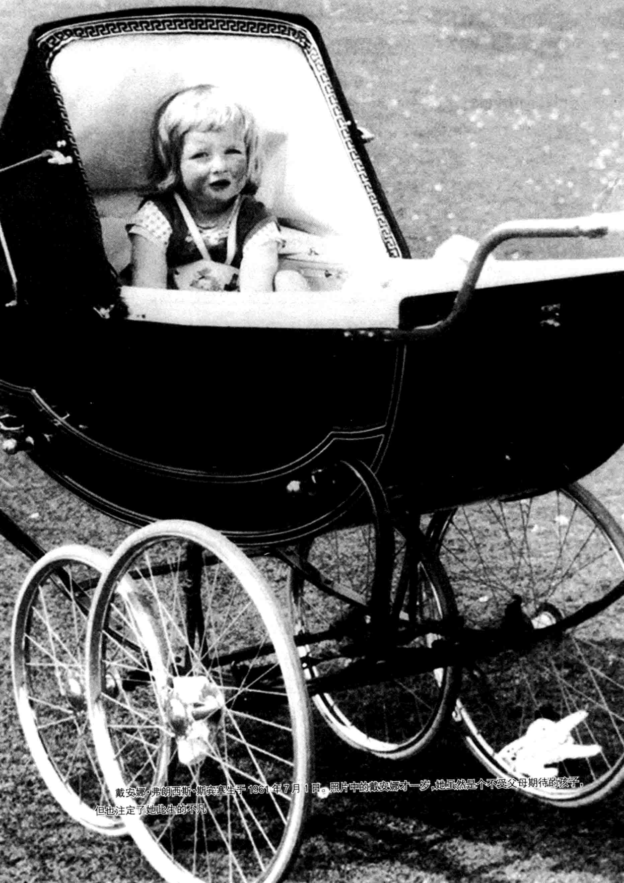
戴安娜·弗朗西斯·斯宾塞生于1961年7月1日。照片中的戴安娜才一岁，她虽然是个不受父母期待的孩子，但也注定了她此生的不凡。