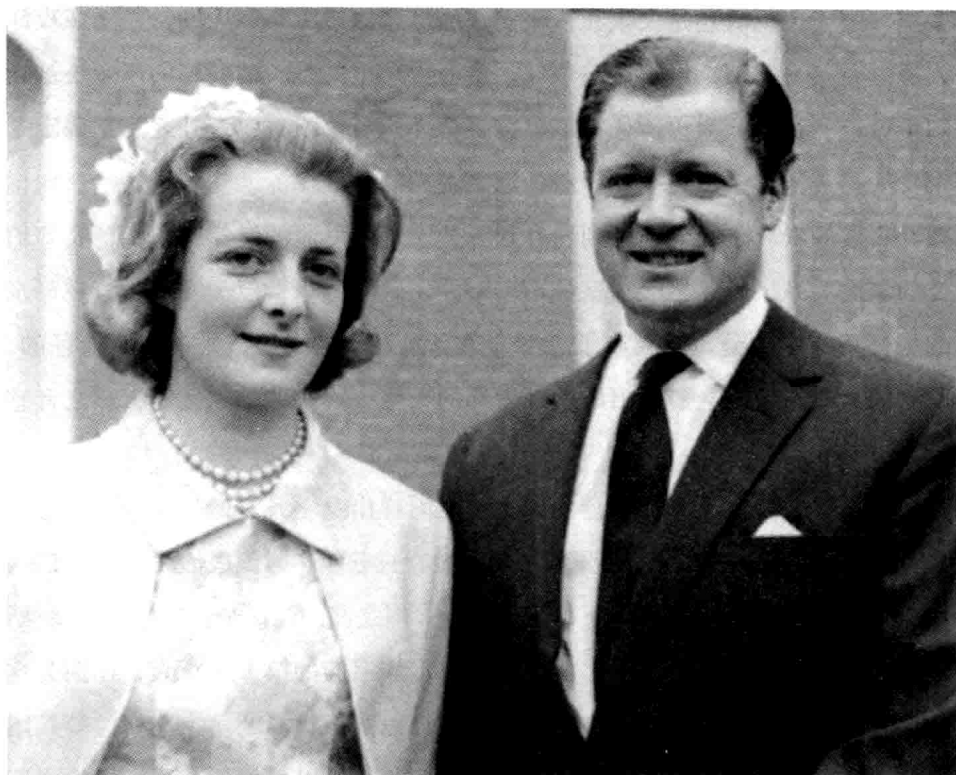
戴安娜的父亲约翰·斯宾塞伯爵和母亲弗朗西斯·斯宾塞于1954年在威斯敏斯特教堂结婚，二人于1969年离婚