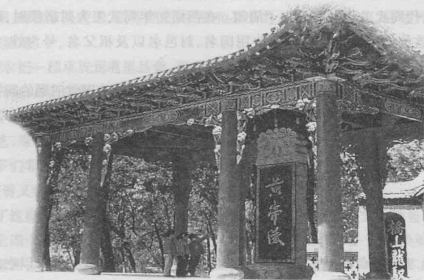
位于陕西黄陵县城北桥山上的黄帝陵,是传说中中华民族祖先轩辕氏之墓。

黄帝与蚩尤之间的战争,不论哪种说法最为真实,它都奠定了黄帝天下共主(相当于王)的地位。黄帝擒杀了蚩尤后,统一了中原部落。而后,黄帝率兵进入九黎族地区,并在泰山之巅,会合天下诸部落,告祭天地,举行了隆重的封禅仪式。因在其封禅之时天上显现黄色的大蚓、大蝼,人们说他以土德为帝,所以号称为黄帝。之后,黄帝展开了一系列改革。如:建立古国体制,划野分疆,八家为一井,三井为一邻,三邻为一朋,三朋为一里,五里为一邑,十邑为都,十都为一师,十师为州,全国共分九州,因此才有了“华夏九州”之说。