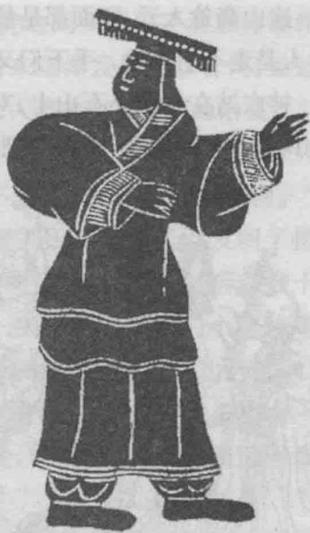
山东武梁祠石刻黄帝像,他似乎正在向族人传授自己的发明。

黄帝共有25个儿子,并把其中14人分封给姓。这14人共得到12个姓,分别是姬、西、祁、己、滕、葳、任、荀、僖、媯、偃、衣。而少昊(己姓)、颛顼(次子昌意之子)、帝喾(长子之孙)、唐尧(长子玄孙)、虞舜(次子八代孙),以及夏朝、商朝(子姓)、周朝的君主都是黄帝的子孙。后来的五帝少