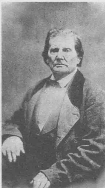
林肯的父亲托马斯·林肯