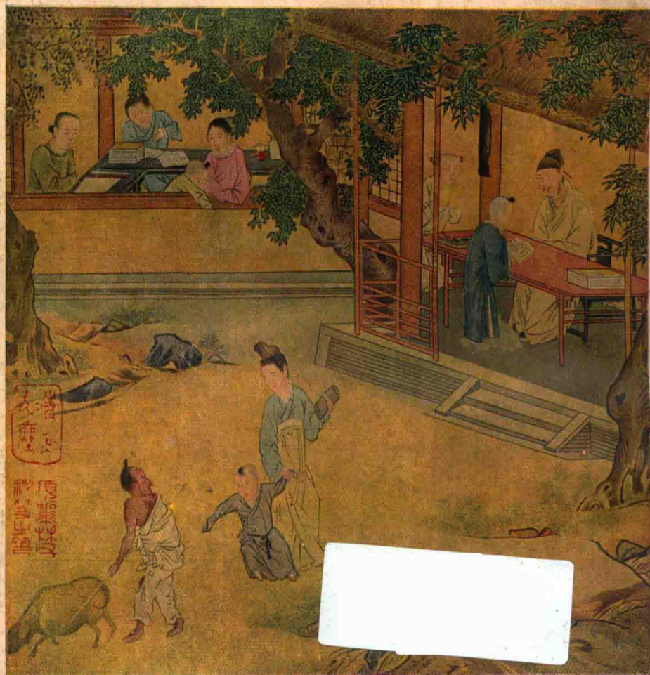
『圖子教母孟』畫名人宋藏珍閣籟天