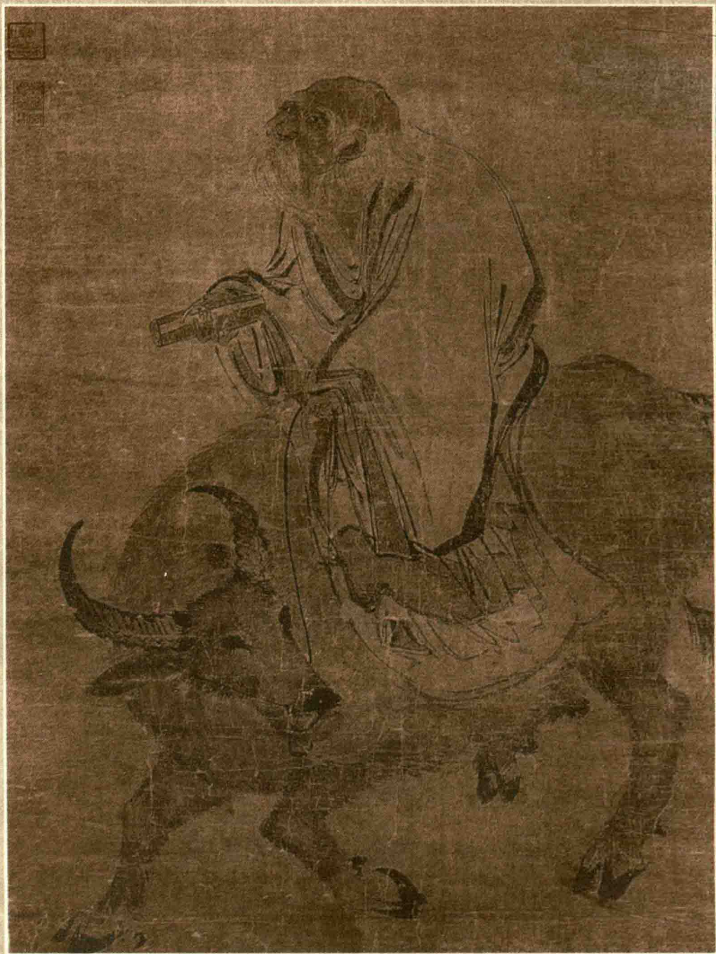
老子骑牛图 清·张 路