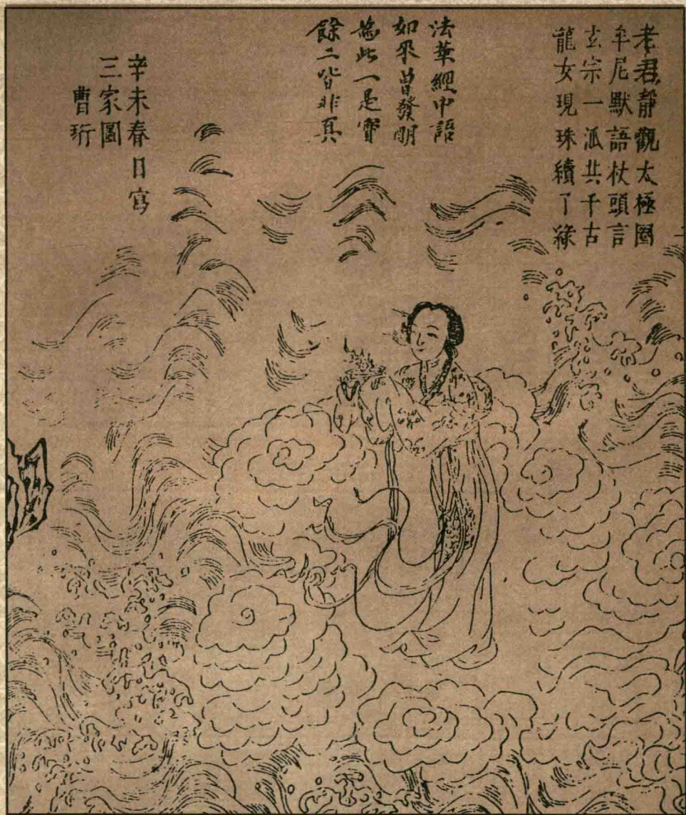
乾 三家圖證 明·曹士珩