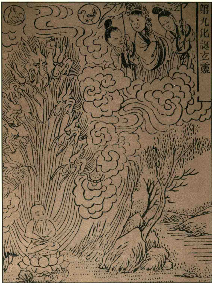
第九化诞玄灵图·《老君历世应化图说》

注释：①道可道：道指自然规律，自然法则，化生万物的本源。後一个道是“表达，说”。②常道：永恒之道。③名可名：前一个“名”，指名词概念，是对事物真实性和本质的反映。後一个名是“命名”，即用言辞正确地表达概念。④常名：永恒的名，永恒的概念。⑤万物之母：万物的本源。⑥观：探究。⑦妙：深邃奥妙。⑧徼：原意为边界，这里引申为开端、端倪。⑨此两者：指常无和常有。⑩玄：幽味深远。⑪众妙之门：一切变化的总门径。