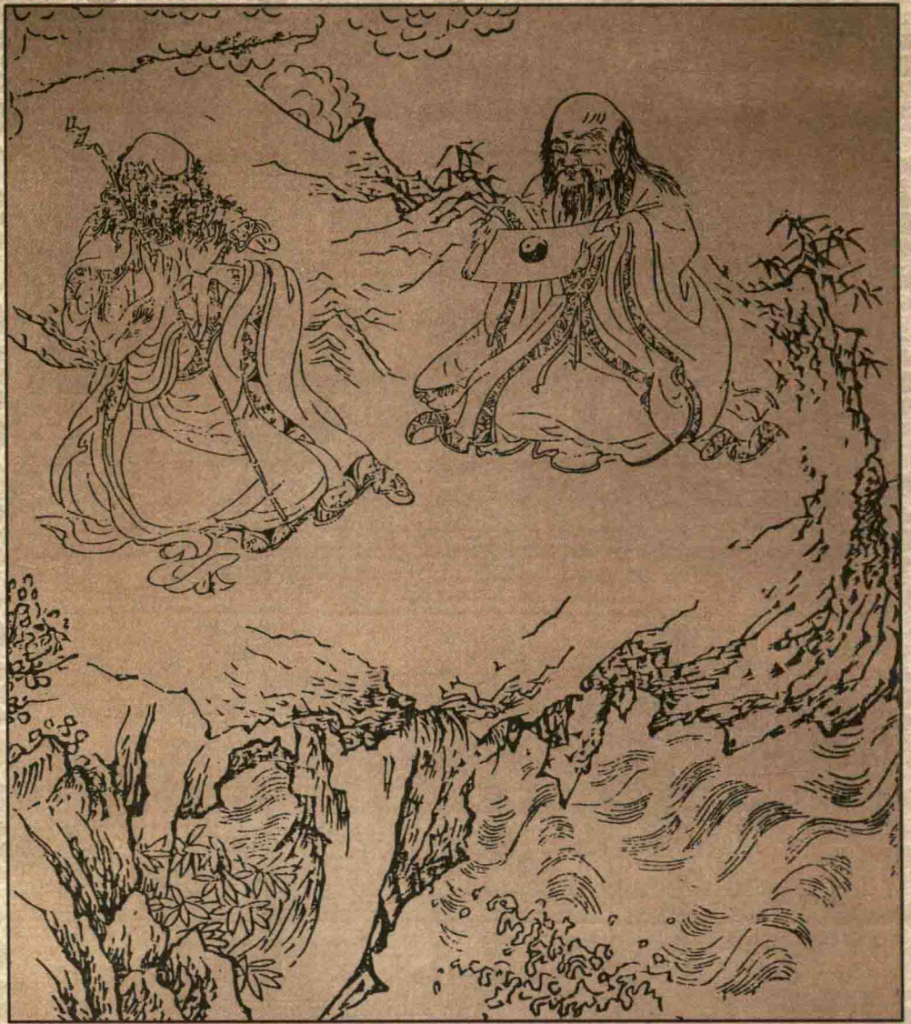
老君静观太极图 明·曹士珩