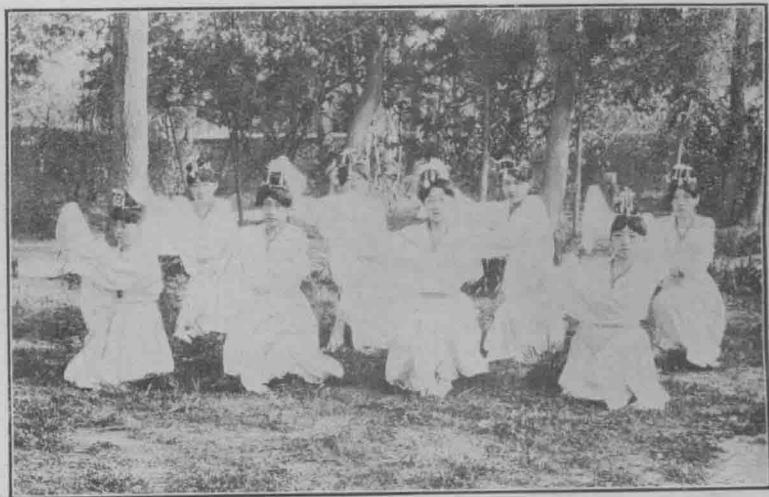
度 低 倫