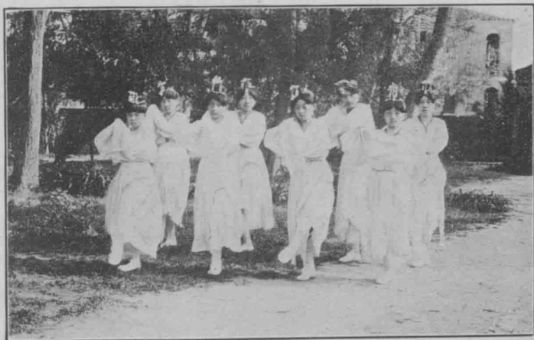
立 獨 呈