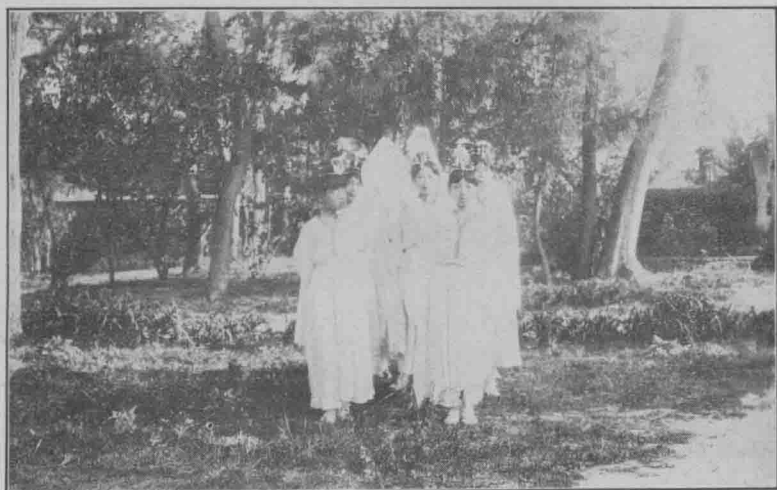
對 瓊 絲 袖 張