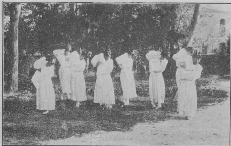
送 遙 聞 惟