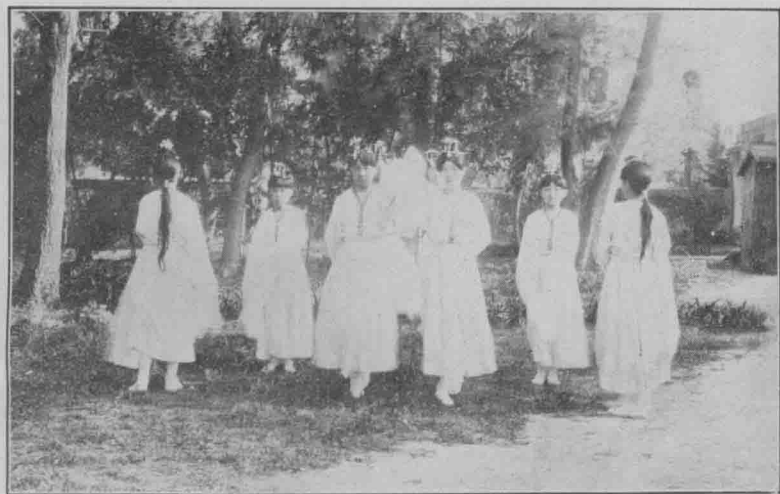
一 溜 秋 光