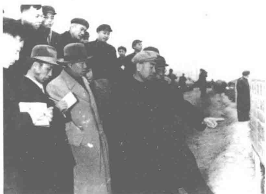
周总理了解干部办试验田的情况