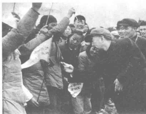
周总理同女民兵干部亲切交谈