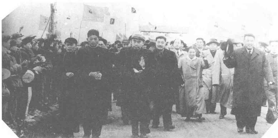
公社群众欢迎周总理一行