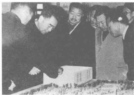
周总理、贺龙副总理听取红旗公社党委书记胡银林关于新村建设的汇报