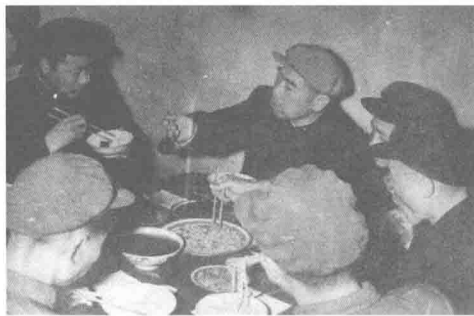
周总理和社员们共进午餐

原本应城县委准备了丰盛菜肴。总理审查菜单时全部否定，强调只准四菜一汤。一再要求下，总理才同意增加一个荤菜。最后，桌上的菜品是：一碗豆芽、一碗菠菜、一碗芹菜炒肉、一碗木耳炒猪肝、一碗鱼、一碗豆