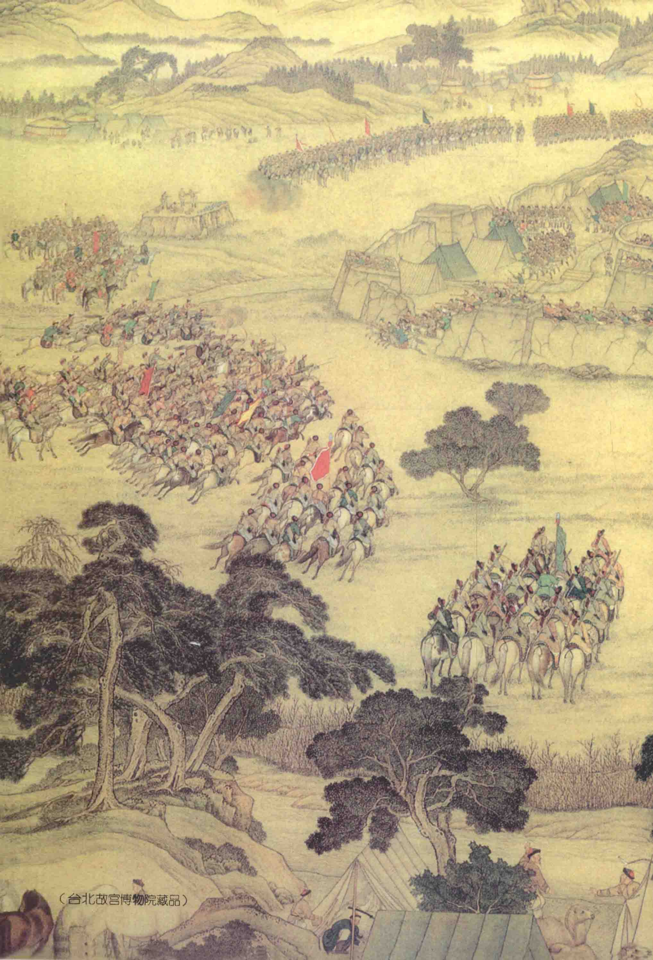
(台北故宫博物院藏)