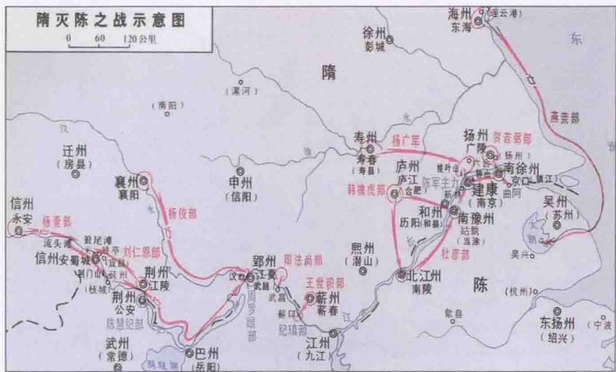
◇ 隋灭陈之战示意图

陵渡江，攻下京口（今江苏镇江）。韩擒虎自横江渡采石，进拔姑孰（今安徽当涂）。贺、韩两军东西夹攻建康。陈将萧摩诃被俘，任忠出降。隋军直入朱雀门，城内文武百官纷纷逃散，陈后主与张贵妃、孔贵嫔躲到景阳宫内枯井中，为隋军所获。杨素与刘仁恩率水军下三峡，大破陈将吕忠肃，乘胜至汉口，与杨俊相会。时建康已破，杨广使陈后主以手书招降上江诸将及岭南女首领冼氏，于是南方全部平定。