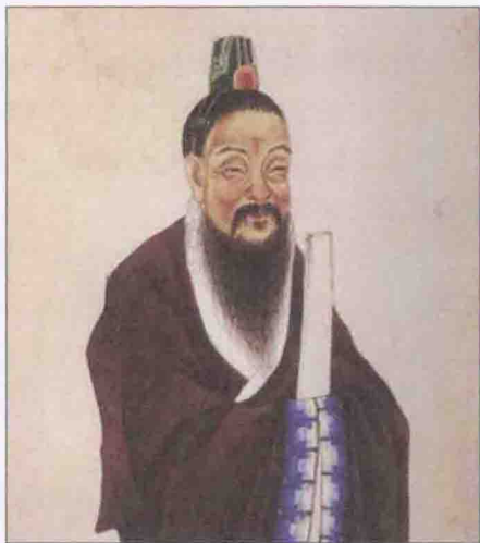
◇ 箕子朝鲜始祖，“殷末三仁”之一箕子像

高句丽这个民族是我国东北大地上一个土生土长的原住民族，是由居住在我国东北的濊貊族中分离出来的一个支系，所以又被古代史家称为貊人。高句丽作为族名在西汉初年就已经存在，汉武帝统一卫满朝鲜之后，在玄菟郡中设立高句丽县，从此高句丽才作为地名为人所熟知。高句丽族