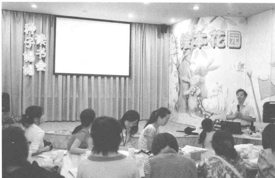
图4 种子妈妈读书会