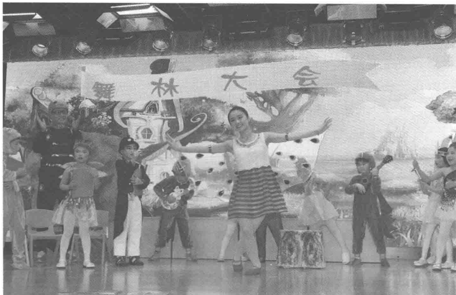
图3 “亲子共演 温暖家园”江阴市第三届儿童绘本剧表演大赛

让人感受到了浓浓的亲子氛围。“家庭亲子参与绘本剧大赛”不仅为家长和孩子搭建了一个提升艺术想象和展示表演能力的平台，更是激发了他们对绘本的兴趣，提高了语言表达能力，让孩子们在懂道理、学知识的同时，激发幼儿表现的欲望。