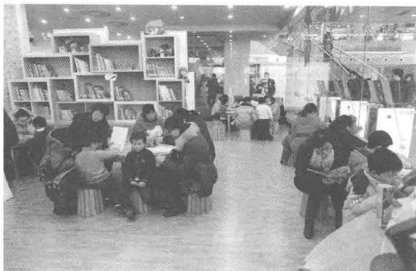
图1 儿童绘本馆阅读场面

通过舞台表演将绘本故事进行展演，让爸爸妈妈和孩子一起成为故事的主角，将有趣的绘本故事变成生动的情景剧，让“绘本亲子阅读”变得更立体和形象。活动开展以来受到广大家庭的积极参与，目前累计有36个家庭表演了37个经典绘本故事。“亲子读演坊”让孩子们更深入地了解绘本，有了与爸爸妈妈一起共同表演合作的机会，每一个家庭成员都化身成绘本中的角色，浓浓的亲情跟绘本融为一体，阅读绘本的意义也已不再限于读书本身。（图2）