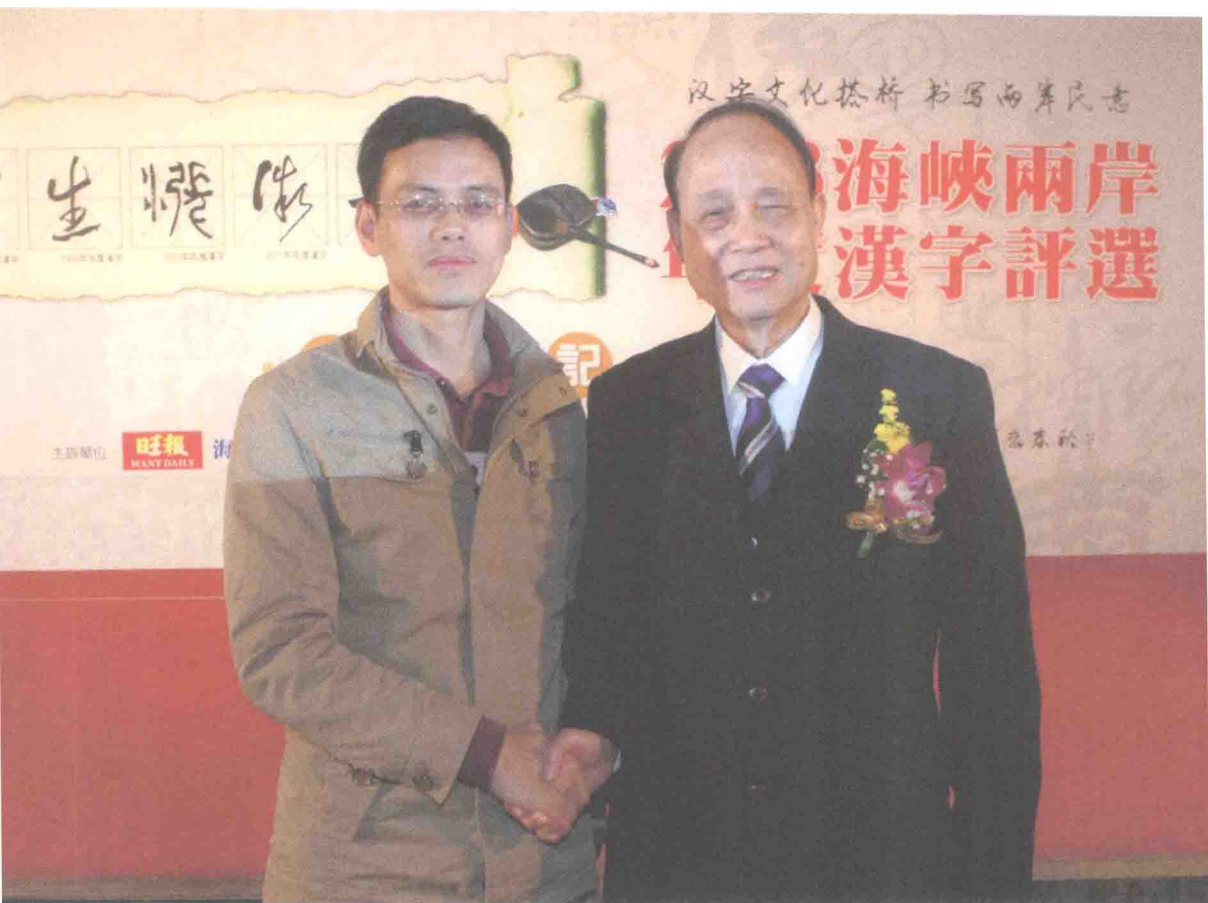
2013年作者和海基会董事长林中森合影