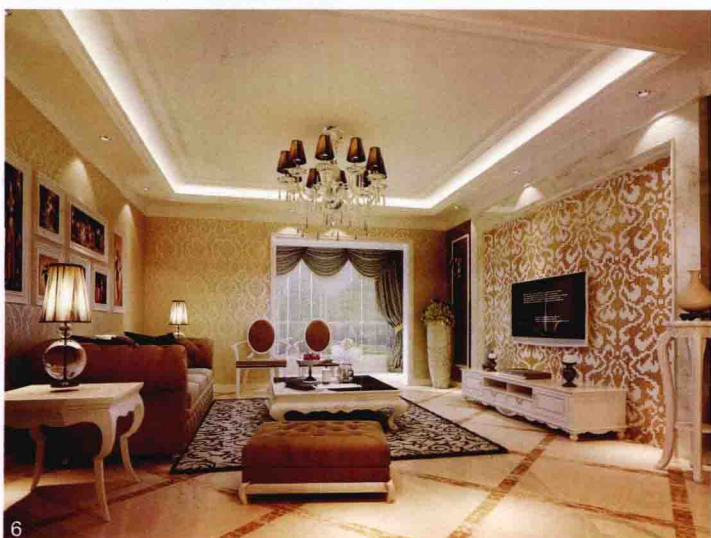
1. 客厅电视背景墙用大芯板做造型，白色混油饰面，内嵌水银镜。