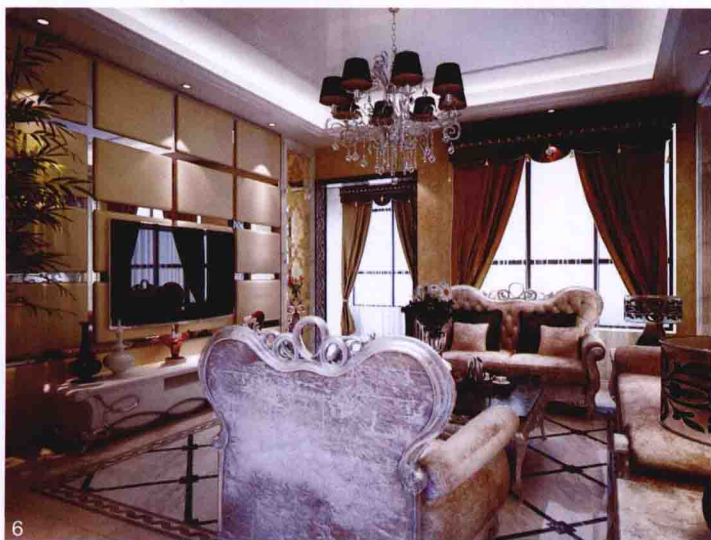
1. 客厅电视背景墙用石膏板做造型，中间用壁纸胶粘贴装饰壁纸。