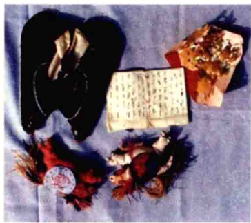
袖珍女书和女红：绣花鞋、剪纸、针线包