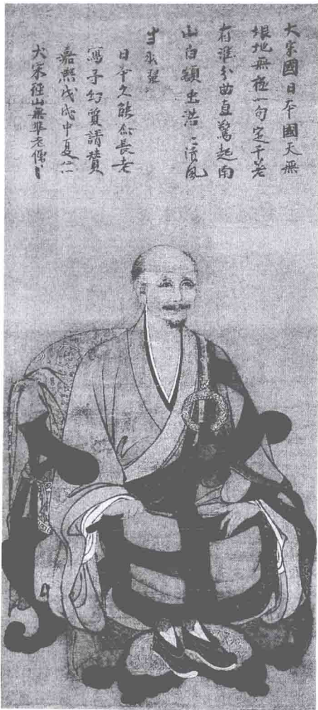
◎ 无准师范（东福寺藏）

当时，中日两国贸易额度相当巨大，1298年北条得宗家一条开往中国的船只在五岛列岛沉没。根据古文书的记载，船上装载金、水银、绢布等和少量武器、漆器等工艺品。1976年1月，韩国全罗南道新安冲海底发现了一条巨大的古代沉船。根据数年的发掘，从这条沉船上发掘出土了一万八千六百余件青、白瓷器，铜钱八百万枚，紫檀一千余件。从出土的文物上看，这是一条于1323年沉没的寺社造营料唐船。该船为筹建九州东福、承天等寺的僧侣们在中国福建地区所制造的，由宁