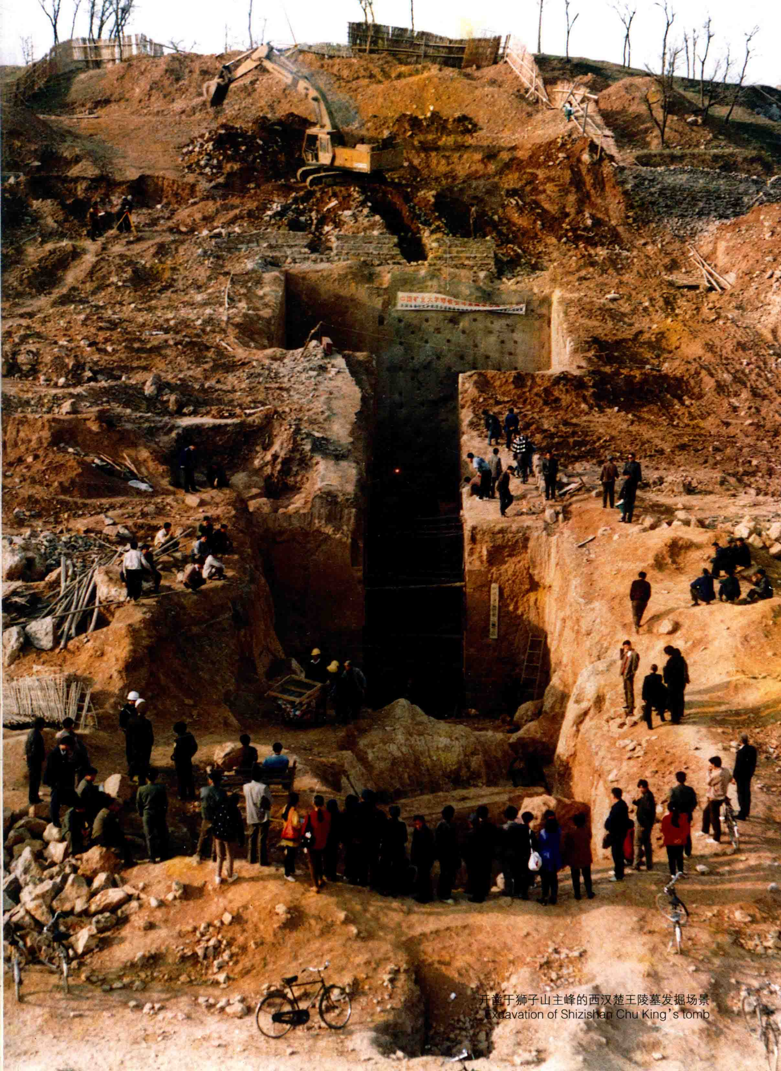
开凿于狮子山主峰的西汉楚王陵墓发掘场景 Excavation of Shizishan Chu King's tomb