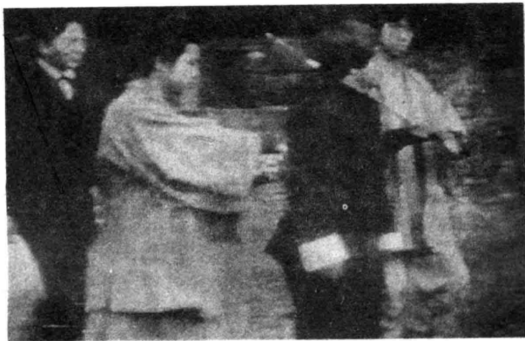
9. 张和命令日本武士把皇甫一骠押到祠堂里去审问。