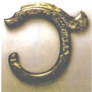
图 2-6 红山文化“C”字形玉龙

石器的制作,起源于旧石器时代。旧石器时代遗址,常发现打制石器、原始骨器,以及用于装饰的动物牙齿、贝壳、人和动物的骨化石等。新石器时代