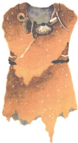
图 2-3 原始服饰想象复原图 (根据出土的骨针、骨锥等制衣工具想象复原而成)

顶洞人时期,正是中国服装的发祥期,这时人们已用骨针缝制兽皮的衣服,并用兽牙、骨管、石珠等制成串饰进行装扮。 [1] 这里曾发现串在一起的串饰(图 2-1), [2] 另外,山顶洞出土了一枚磨得细长,一端尖锐,另一端有针孔的骨针(图 2-2), [3] 这是缝制兽皮衣服的工具,缝线可能是用动物韧带劈开的丝筋,现在,我国鄂伦春族人还保留着这种古老的方法。山顶洞人佩戴的装饰品的穿孔,几乎都带有红色,似乎他们的穿戴是用赤铁矿研磨的红色粉末染过的(图 2-3)。 [4] 山顶洞人不仅关心生活的美,而且也表现了对死者的关怀,他们埋葬死去的亲人,并举行仪式,还在死者身边撒下红色赤铁矿粉末。红色在原始人意识中是血液的象征,失去血液便失去生命,使用红色有祈求再生之意,说明原始人的色彩观念是和原始宗教观念交织在一起的。