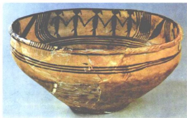
图 2-5 舞蹈纹彩陶盆(青海大通出土,中国历史博物馆藏)

新石器时代除有笼统式服装贯头衫外,从原始彩陶遗物还可发现反映当时服装状况的珍贵资料,如冠、靴、头饰、佩饰等。青海大通县上孙家寨新石器遗址出土的马家窑文化舞蹈纹彩陶盆,盆上用影绘的方式表现三组舞人,舞人所穿均为窄袖紧身、长与膝齐的衣服,画面为了表现动