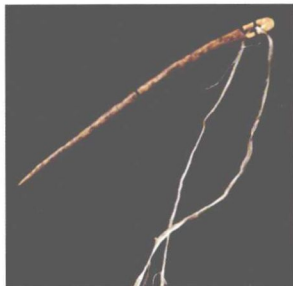
图 2-2 骨针(旧石器时代晚期,北京周口店出土)