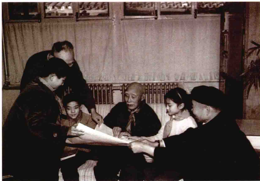
叶圣陶在家里和孩子们在一起。