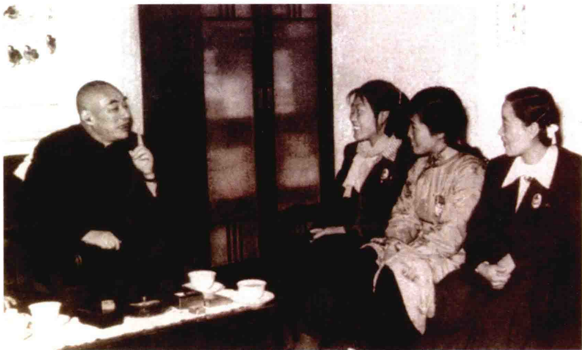
1956年5月6日，叶圣陶接受参加全国先进生产者代表会议的三位少数民族教师的访问。