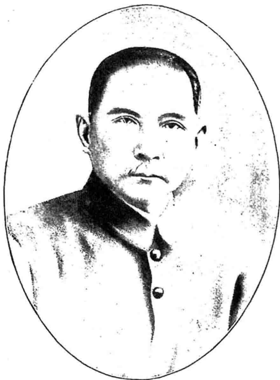
像 遺 理 總