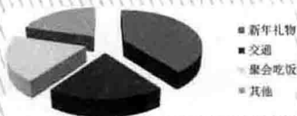
我国某市居民春节假期花销比例

Write an essay based on the following chart. In your writing, you should 1) interpret the chart, and 2) give your comments. You should write about 150 words on the ANSWER SHEET. (15 points)