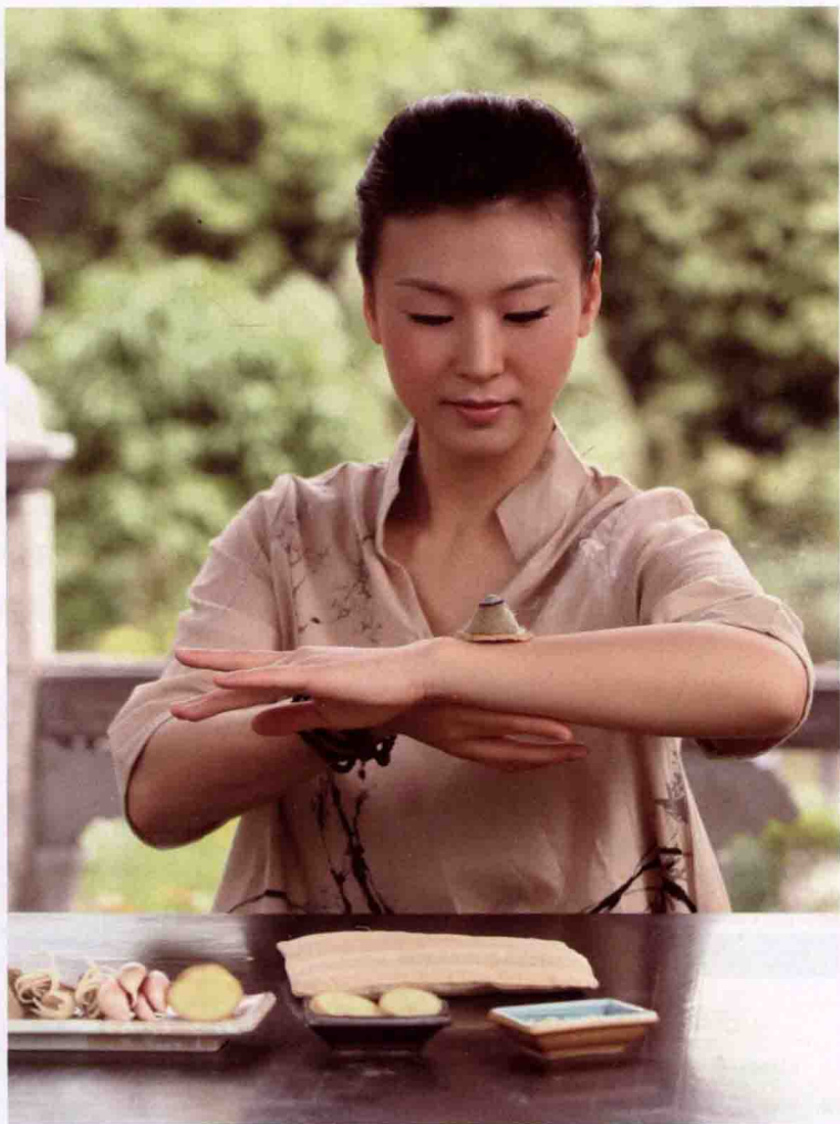
◎ 用艾贴近皮肤灼烧即为艾灸

现在在日常生活中艾条灸和隔物灸用得比较多，两者虽然都没有直接贴着皮肤灼烧，但依照惯例同样被称为“灸”。其中艾条灸操作简单、疗效显著、无毒副作用，在家自己灸疗时相对来说会更常用到。