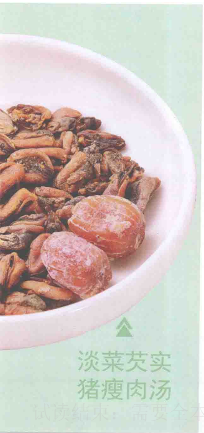
▲ 淡菜芡实 猪瘦肉汤