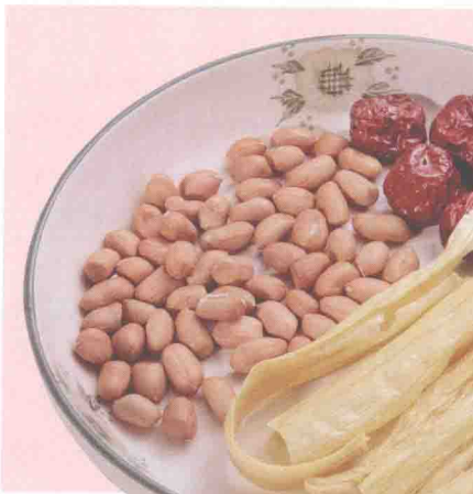
◀ 花生支竹 大鱼头汤