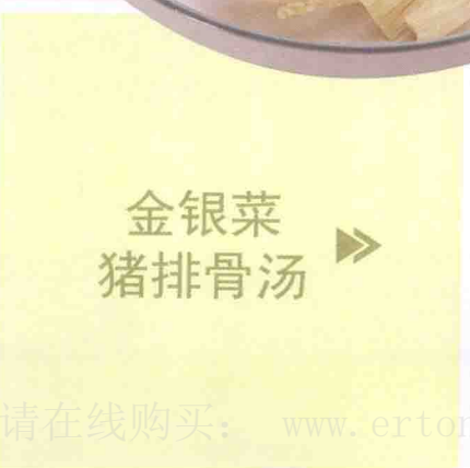
金银菜 猪排骨汤 ▶