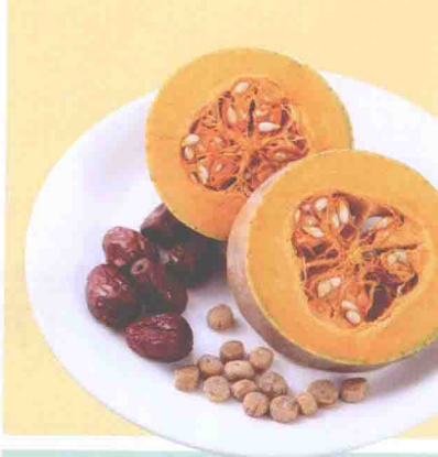
▲ 南瓜红枣 猪排骨汤