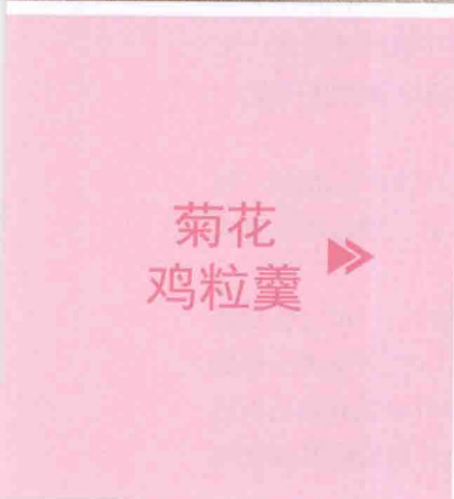
菊花 鸡粒羹 ▶