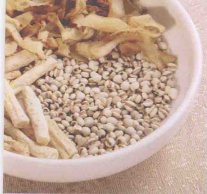
◀ 沙参玉竹薏米 猪蹄汤