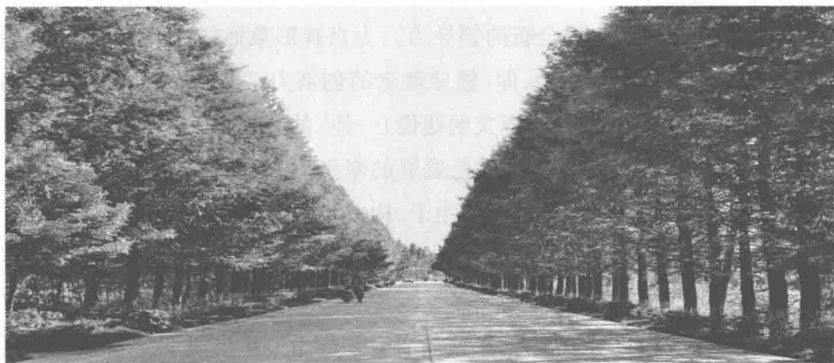
图 0-1 南部县“13215”绿色通道