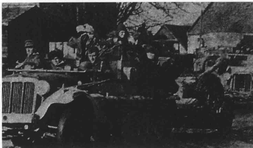
◎ 虽然德国装甲师武器相对精良，机动化程度也相对较高，但是从总体上说，即使到了1944年，德军的机动化程度也没有1940年在法国作战的英军高

他们与大队的距离由具体战况、地形、信号设备有效范围等决定。不过通常来说，他们离大队不超过一小时的行进路程（约25英里）。大队是侦察小分队的后备力量，是先遣队的信息中心，为后方部队搜集、传送信息。机动化侦察小分队有装甲侦察车、半履带装甲车和摩托车，具体配置由小分队的任务和当时的情况来确定。摩托车用于填补侦察漏洞，能使侦察网