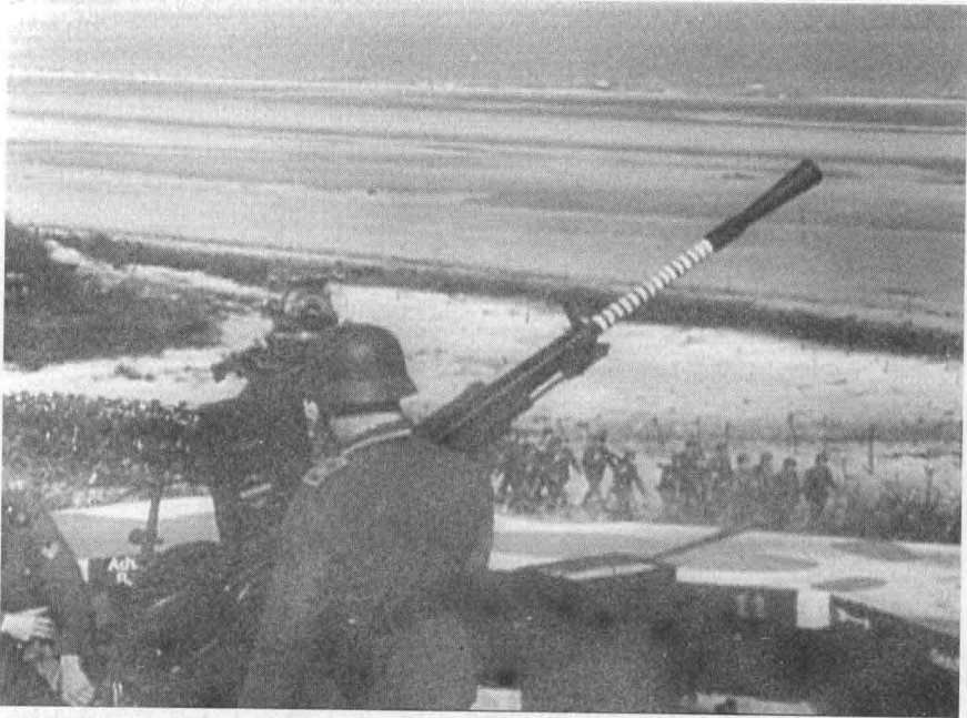
◎ 德国海防部队在高射炮的掩护下进行演习