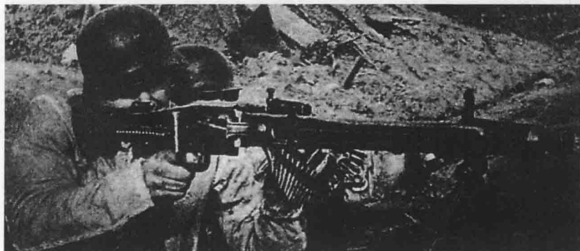
◎ MG42式中型机枪火力凶猛，射速快，杀伤力强，但是容易卡壳，需要经常维修

他们与大队的距离由具体战况、地形、信号设备有效范围等决定。不过通常来说，他们离大队不超过一小时的行进路程（约25英里）。大队是侦察小分队的后备力量，是先遣队的信息中心，为后方部队搜集、传送信息。机动化侦察小分队有装甲侦察车、半履带装甲车和摩托车，具体配置由小分队的任务和当时的情况来确定。摩托车用于填补侦察漏洞，能使侦察网