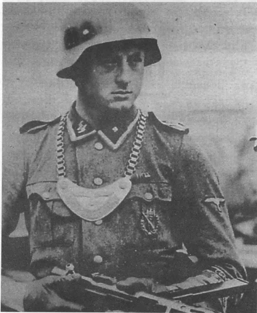
◎ 德国一级下士，他们能领导并激励士兵取得卓越的战功