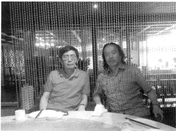
北岛（左）与作者高星

北京对于现在的北岛来说，是一个拒绝进入的地方。在时间上，北京对北岛来说是上20世纪已割断的记忆中的故乡；在空间上，北京对北岛来说，已关闭多年的城门让近在香港的他无法叩响。