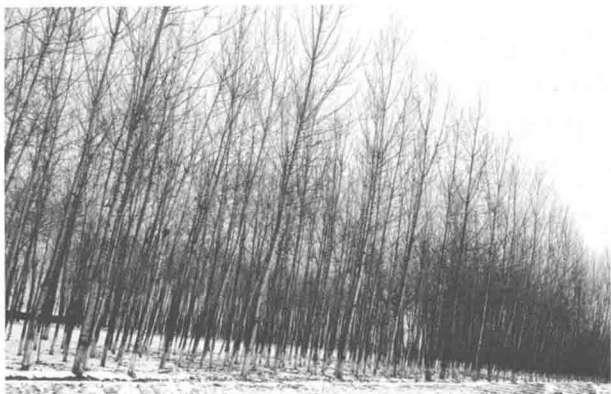
白杨树象征了质朴、坚强的精神

③过铁道时，他先将橘子散放在地上，自己慢慢爬下，再抱起橘子走。(朱自清《背景》)