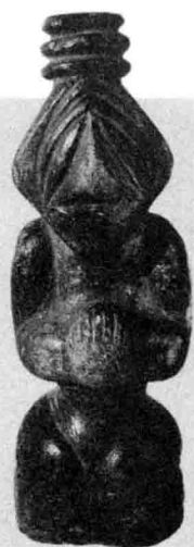
红山文化石人雕像