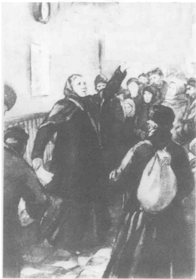
高尔基的作品《母亲》插图