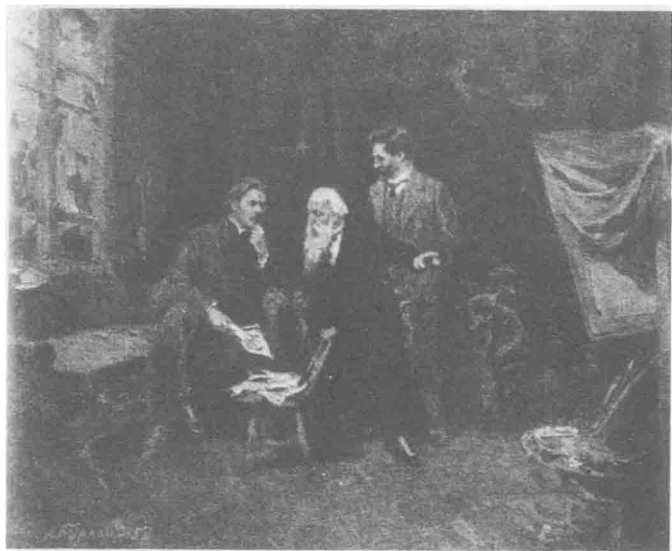
高尔基、斯塔索夫和画家列宾