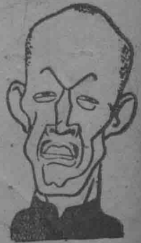
理總務國偽 胥孝[鄭