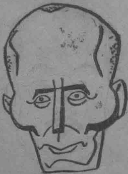
長省天奉兼長總部政民偽 毅式臧