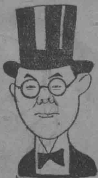
長市濱爾哈僞 澄觀鮑