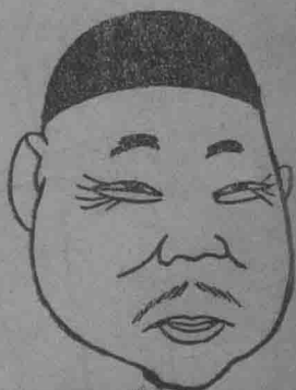
長總部交外僞 石介謝