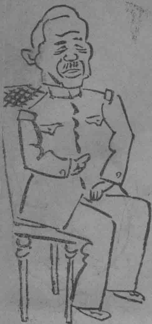
前關東軍司令 一本繁庄