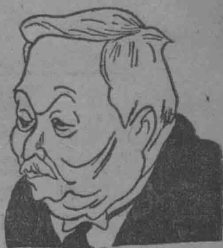
日 首 相 齋 藤 實