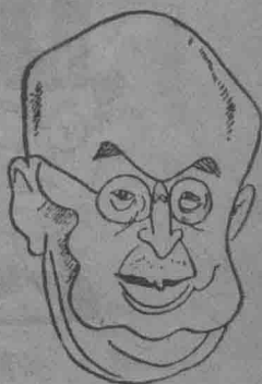
日本滿鐵總裁 林博太郎