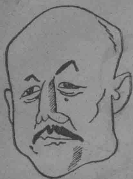
僞參議府議長兼軍政部長 張景惠