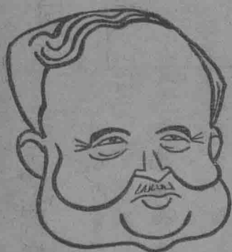
日 外 相 內 田 康 哉