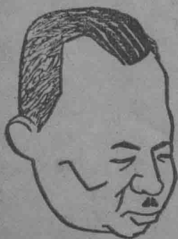
前 僞 國 務 院 總 務 長 駒 井 德 三