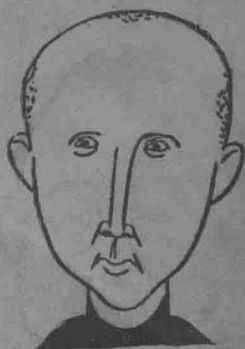
長部部導指治自僞 冲漢于