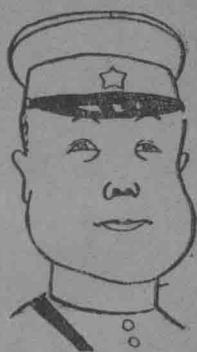
僞財政部總長兼吉林省長 熙洽