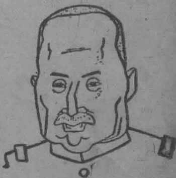
日 本 駐 僞 國 特 派 全 權 人 使 武 藤 信 義