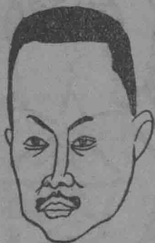
長總部業實僞 卿燕張