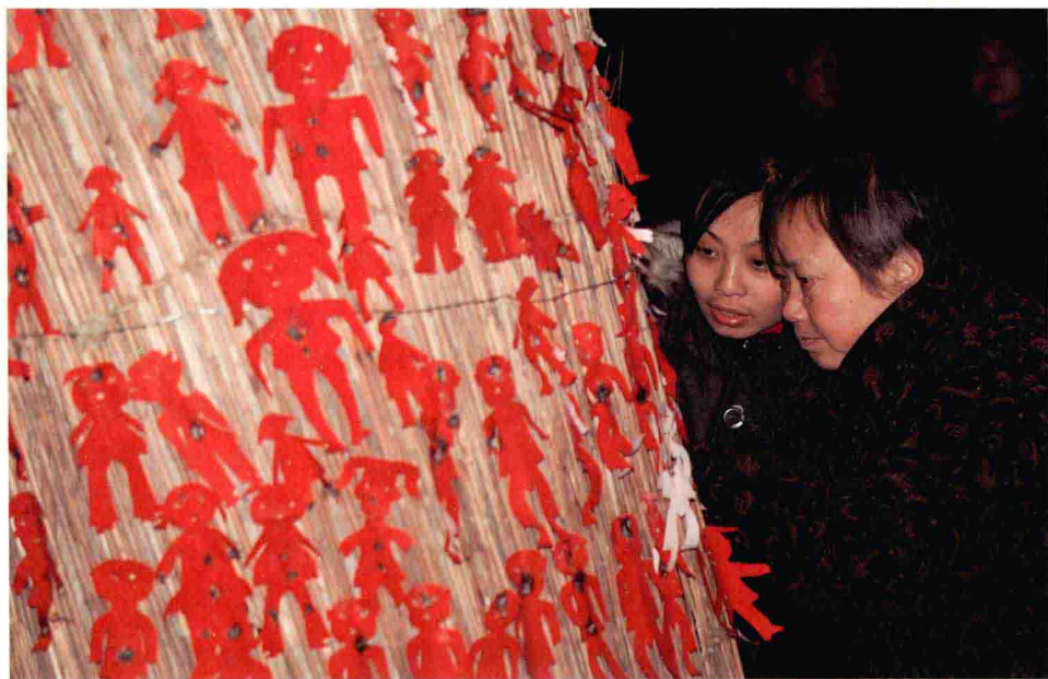
每年农历正月十六在伏羲庙点纸人是流传天水民间的习俗，颇有祈福之意