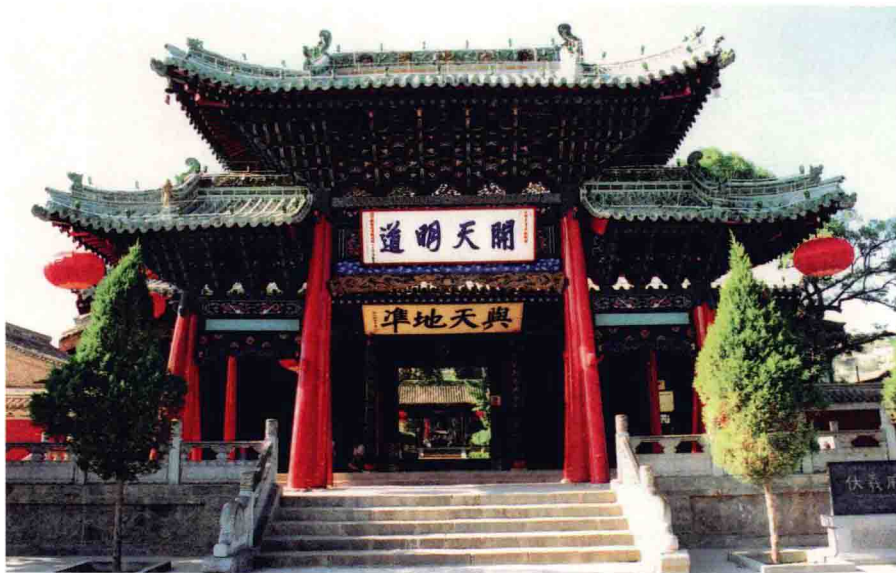
雄伟、庄严的伏羲庙门，上悬“开天明道”四个大字，为清乾隆西宁道湟中观察使杨应琚手迹，其词是对伏羲功德的歌颂