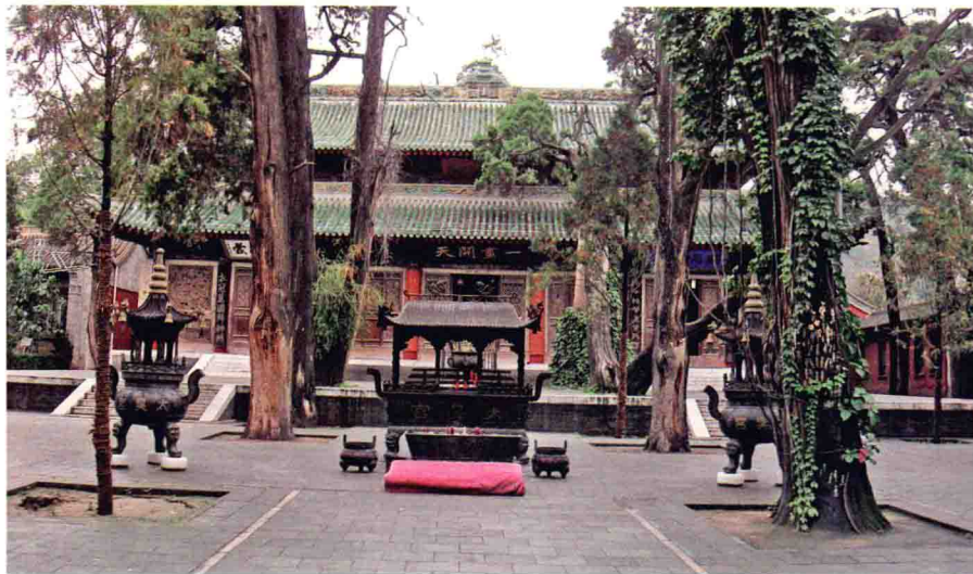
先天殿，是伏羲庙的主体建筑。游客散去的时候，寂静里的丝丝肃穆，令人心若止水