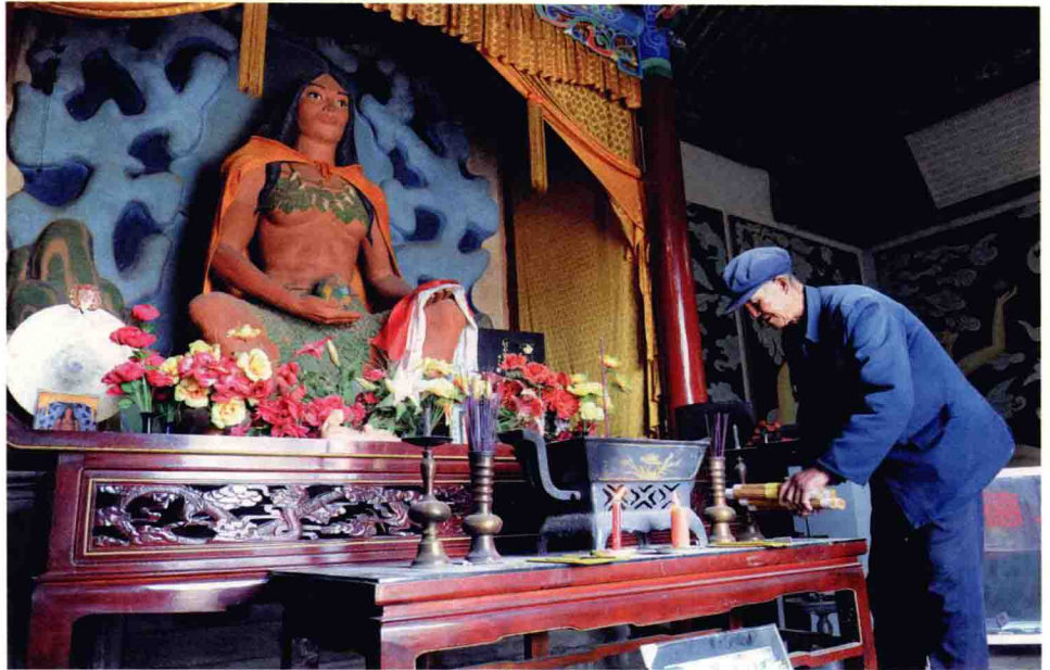
天水秦安县陇城镇有女娲祠，祠内供奉女娲，是当地的一方神明

为我国人类早期社会摆脱蒙昧跨入文明作出了重大贡献，开创了中华文明的先河。在这个漫长的过程中，他用一盏文明的灯火，引导先民摆脱了茹毛饮血、巢穴群居、鸿蒙未启的原始状态，跨入了文明社会阶段。