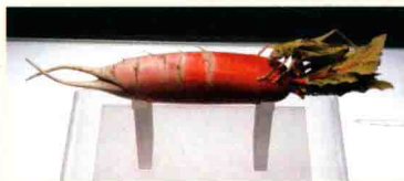
象牙雕刻萝卜烟筒 河南省博物院展出

象牙因体形硕大、质地坚硬、外表白皙、细密可雕，备受我国历代工艺大师喜爱。由象牙雕刻成的工艺品，从古至今一直被历代上层社会所追捧和独享，象牙雕刻工艺也日渐精湛。