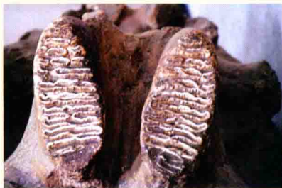
纳玛古菱齿象头骨(腭面视) 周口店猿人遗址出土

纳玛古菱齿象头骨(腭面视) 周口店猿人遗址出土 时期，成为黄帝去泰山祭祀时的坐骑。《吕氏春秋·古乐》也记载：“商人服象，为虐于东夷，周公以师逐之，至于江南。”这说明商代时人们还在驯养大象，周王曾指挥军队将大象驱赶到江南，把它用于征服异族的战争。周朝时，由于气候的变化和江