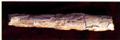
纳玛古菱齿象门齿·周口店猿人遗址出土

时村民们演奏象脚鼓，狩猎、打仗时穿上象皮编织的皮裙。地处中原的汉族古时也有崇象习俗。战国