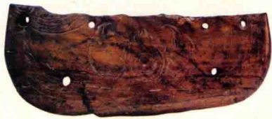
象牙雕刻双鸟朝阳纹蝶形器 河姆渡遗址出土 浙江省博物馆藏

到了三四千年前的商周时期，象牙雕刻则融入了青铜器物的纹饰、器形，其神秘、凝重之感彰显出王权凌厉之美，从而成为上层贵族显示权势的象征。由于象牙工艺品相对于青铜器来说，制作较为容易，所以用途更为广泛。只是受原料体量比较