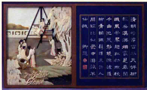
象牙雕刻《月曼清游册》之一 故宫博物院藏

用“蝴蝶装”的形式，在象牙浮雕基础上，镶嵌金银宝石作为点缀。每册左侧是画面，右侧是乾隆帝根据画面内容题写的御制诗。例如：