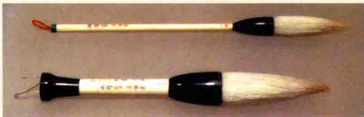
清彝英制象牙雕刻羊毫笔 首都博物馆藏