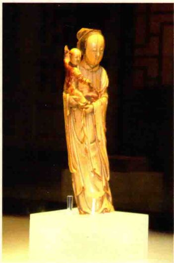
明象牙雕刻观音送子像

由于明清两代定都于北京，服务于皇家的官办作坊在此地自然是大肆兴办，各地能工巧匠任由调遣，工艺种类无所不包，技艺水平为全国之冠。而清代北京皇家牙雕主要集中在如意馆和造