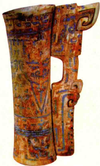
商象牙雕刻夔纹嵌松石杯

西周时期手工业发达。商代手工业曾有“六工”，到西周时已有“百工”，其中就包含专门的象牙雕刻工匠。《周礼·大宰》记载：“以九职任万民”，“飭化八材”。其八材为：切珠、磋象、琢玉、磨石、刻木、镂金、剥革、析羽。磋象即为磨刻象牙。并且，各诸侯国向周王进贡的稀有特产中也包含象牙。鲁国诗歌中就有“淮夷”贡“元龟象齿”之句。