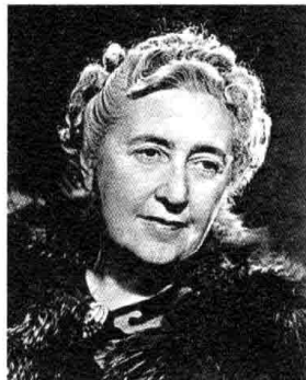
阿加莎·克里斯蒂 Agatha Christie (1890—1976)