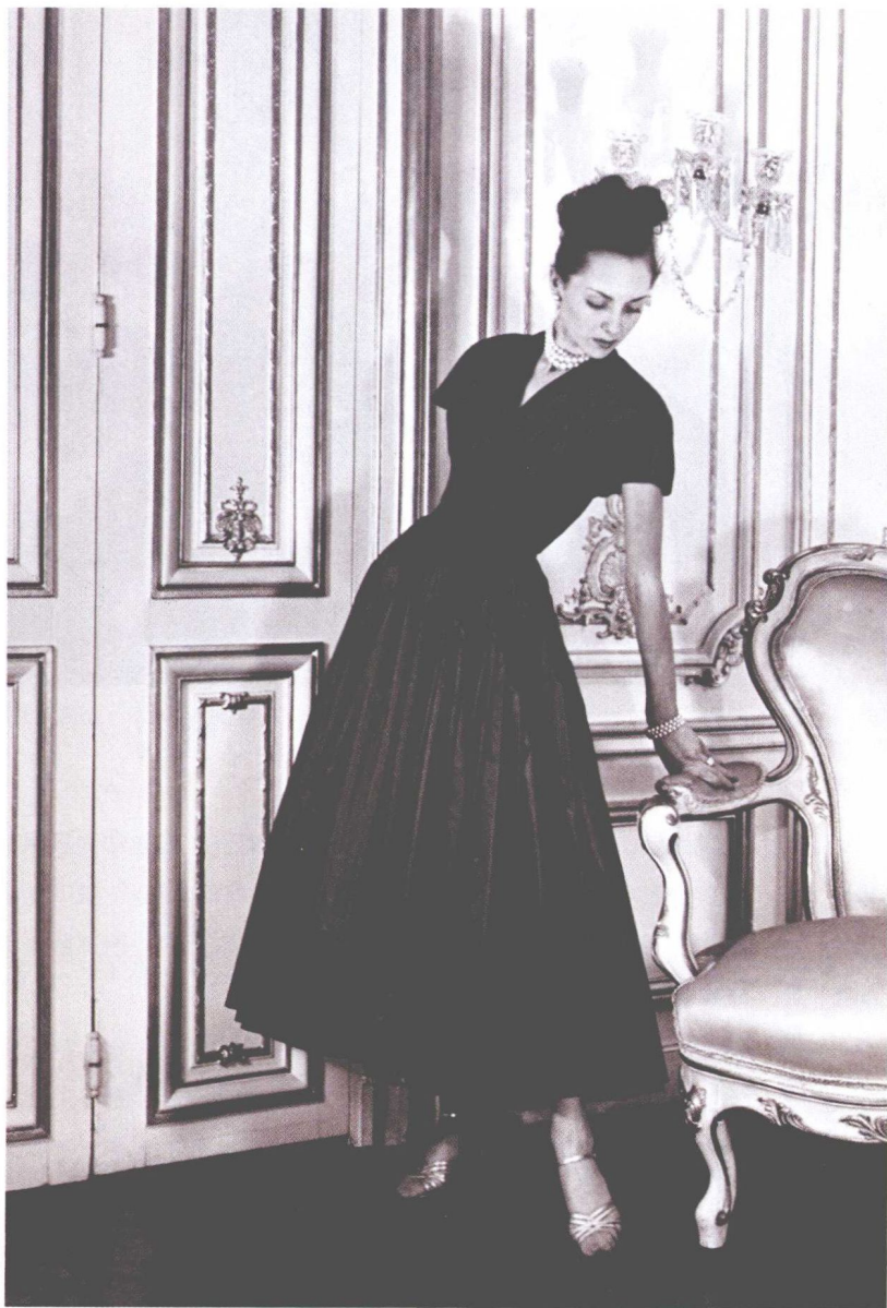
迪奥倒花设计的蓝色塔夫绸晚礼服，系1947年“新风貌”系列春夏装。