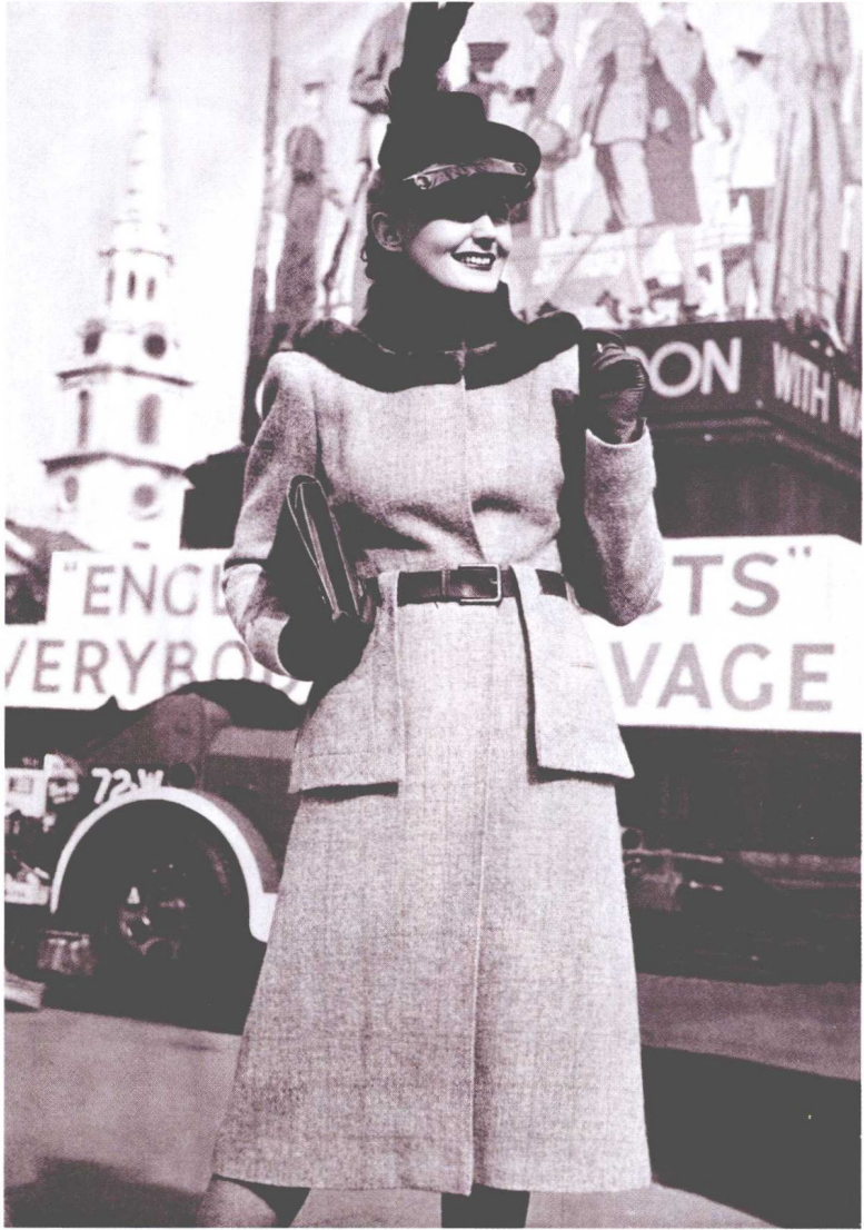
1941年战时的一款时尚束身装，其衣服口袋分开（为节省布料），布料为方格粗花呢绒，出自巴黎帕奎因时装店。