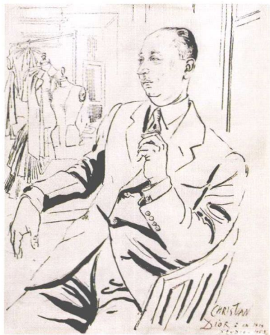
克里斯汀·迪奥的肖像，画于 1954 年，出自塞西尔·比顿之手（来自托马斯的私人收藏）。

新服装系列推出十年后，《时尚》杂志对此作出了总结：“克里斯汀·迪奥的成功秘诀在于抓住了良机，在战争即将结束之际，法国高级服装店正处于萧条时期。此时的“新风貌”率先引领巴黎时尚界，最终于 1947 年 2 月实现了这一宏伟目标。克里斯汀·迪奥能够在此时机扭转乾坤，力挽狂澜，使法国服装业得以重生繁荣，他的魄力倾倒了整个世界，同时也使他自