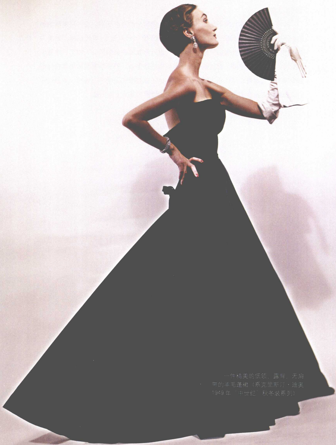
一件精美的低领、露背、无肩带的羊毛蓬裙（系克里斯汀·迪奥1949年“旧世纪”秋冬装系列）