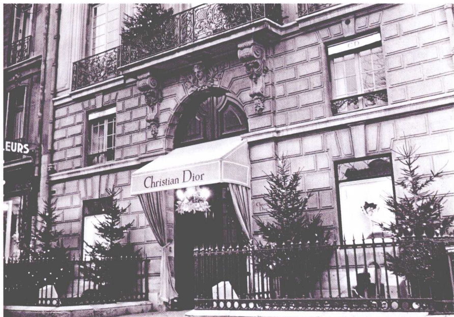
巴黎蒙田大街 30 号的迪奥时装店，如今依然是总部基地。