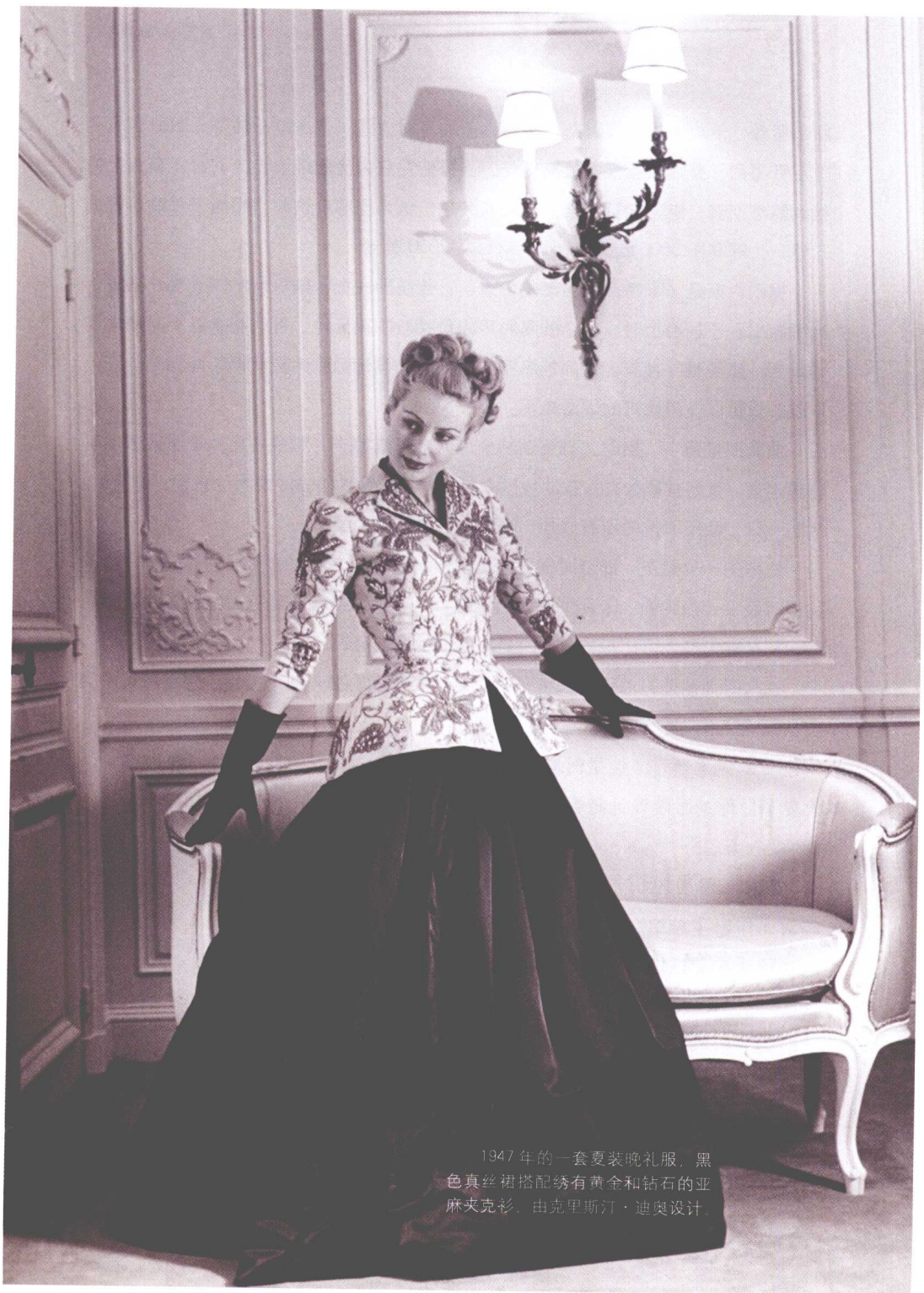
1947年的一套夏装晚礼服，黑色真丝裙搭配绣有黄金和钻石的亚麻夹克衫，由克里斯汀·迪奥设计。