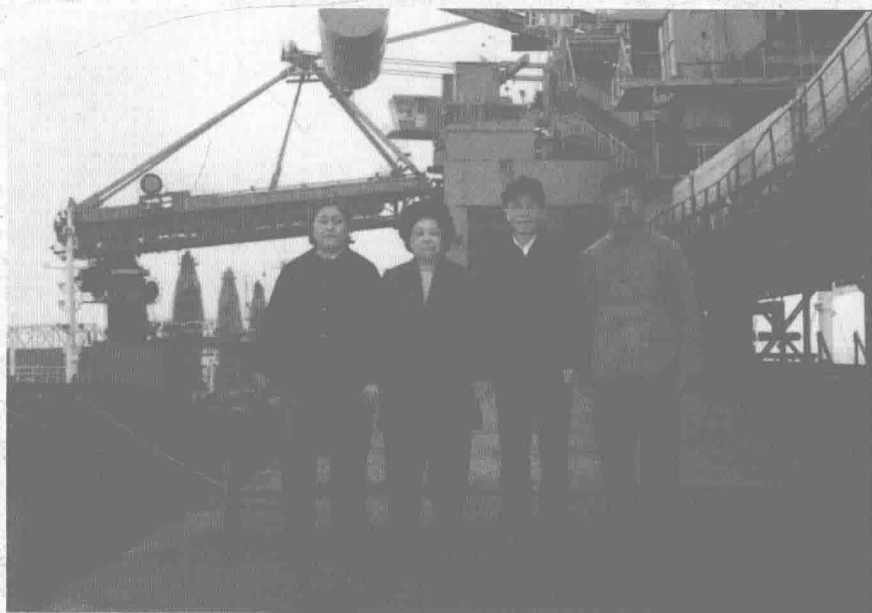
父母親和親戚在日照港邊碼頭參觀。