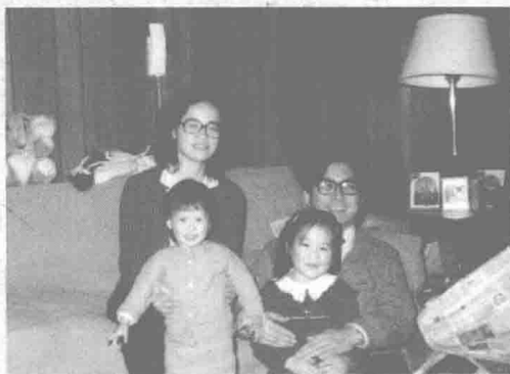
大女兒永潔和二女兒永玲相繼出生，給家帶來很多歡樂。