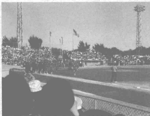
台灣來的青少棒隊在印第安納州的蓋瑞城比賽，許多留學生都從很遠的地方開車為台灣隊伍加油。