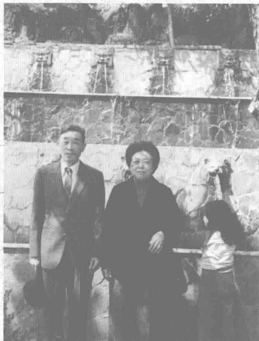
父母親回山東日照省親時，見到家鄉的變化發展和他五十多年前已完全不一樣了。