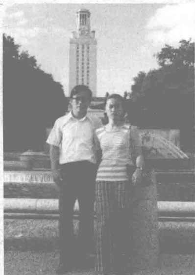
1975年8月偕同新婚妻子到德州奧斯汀。