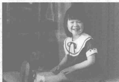
大女兒永潔三歲時可愛的模樣。