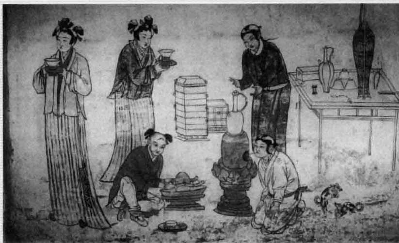
5. 辽代《备茶图》，河北宣化10号辽墓前室东壁壁画