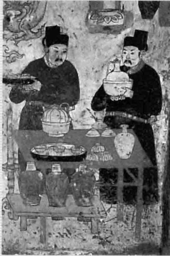
1. 辽代《温酒图》，河北宣化辽墓壁画