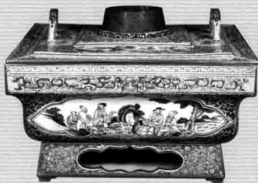
4. 清晚期铜胎画珐琅人物纹火 锅