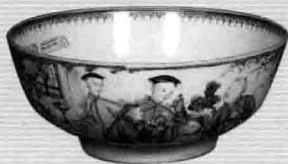
3. 清乾隆年间粉彩满大人碗（观复博物馆 提供）