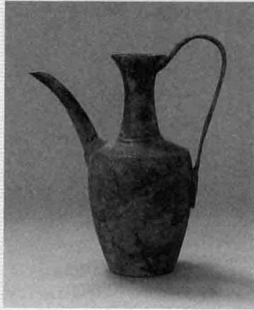
4. 辽代铜执壶(观复博物馆提供)