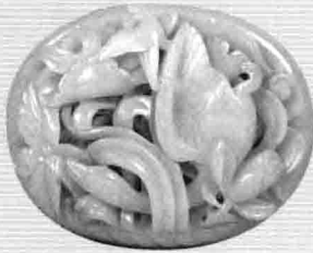
3. 金代青白玉透雕海东青捕天鹅带扣