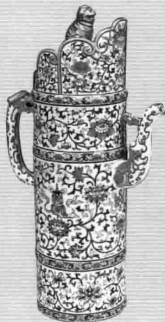
2. 清乾隆款粉彩多穆壶