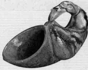
2. 唐三彩角杯，辽宁朝阳唐勾龙墓出土 (《辽宁文化通史》，曲彦斌提供)