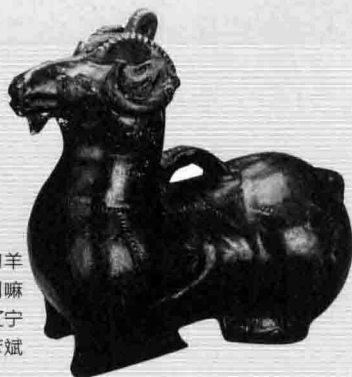
2. 前燕时期的釉陶羊尊，辽宁北票喇嘛洞墓地出土