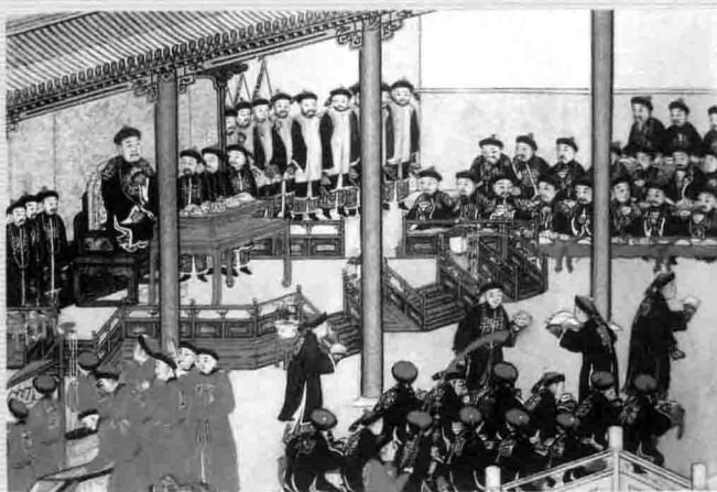
1. 清乾隆皇帝率内外王公、文武大臣于紫光阁筵宴，图为《紫光阁筵宴图》