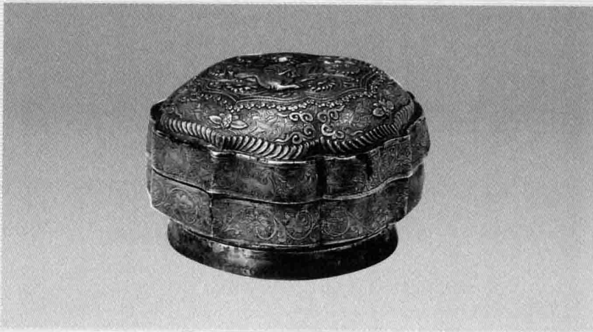
5. 辽代银鎏金双狮纹果盒，内蒙古阿鲁科尔沁旗耶律羽墓出土