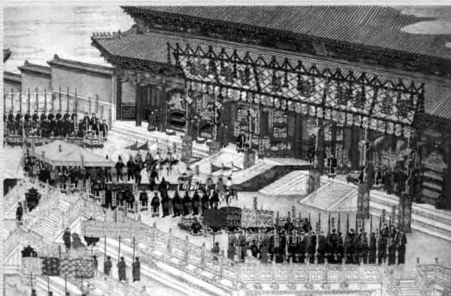
2. 清《光绪大婚图》“太和殿筵宴”