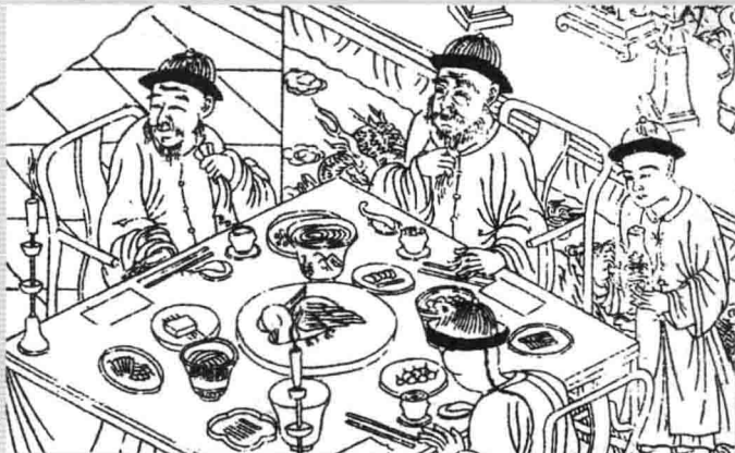
5. 清乾隆时期，上 层贵族于节日 期间的聚会场 面（《清俗纪闻》 “吉期待客”）