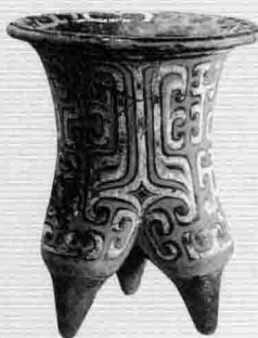
3. 商代大甸子兽面纹陶鬲，内蒙古敖汉旗出土（《辽宁文化通史》，曲彦斌提供）