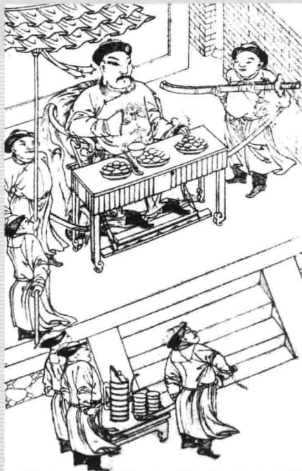
1. 女真族崛起时期的满族饮食生活（《满洲实录》 “额亦都招九路长见太祖”）