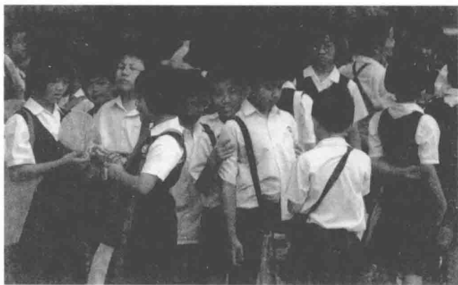
麻六甲華人小學「華文小學」的學生。

麻六甲沿用了兩百餘年的甲必丹制度。英國人治下的馬六甲，地位顯然不及當時剛剛興起的檳榔嶼與新加坡。