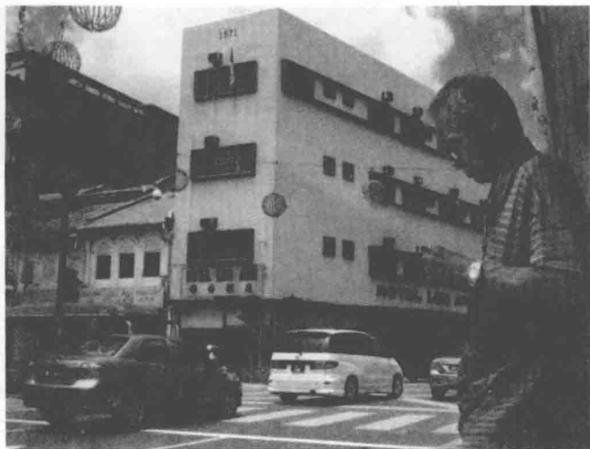
如今麻六甲的街頭，各種文化元素混雜交錯。圖／吳志偉

(baba)·女性則被稱為「娘惹」(nyonya)。他們所說的語言乍聽之下有點像馬來語，同時又有許多貌似閩南方言的辭彙。這是因為早期移民當中以閩南籍居多，長期處在馬來語環境裡，也使他們的下一代在語言上逐漸被同化，最後演變成獨樹一格的「峇峇馬來話」。