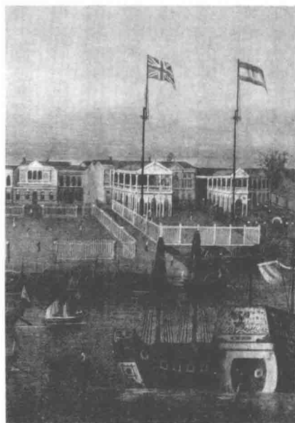
曾經，不論在造船業、航海業還是海上貿易，中國都處在世界的最前端。只是在無數的偶然和可能面前，錯失來臨的機運。圖為清朝時廣州十三行英國和荷蘭的商館。