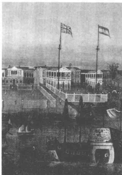
曾經，不論在造船業、航海業還是海上貿易，中國都處在世界的最前端。只是在無數的偶然和可能面前，錯失來臨的機運。圖為清朝時廣州十三行英國和荷蘭的商館。