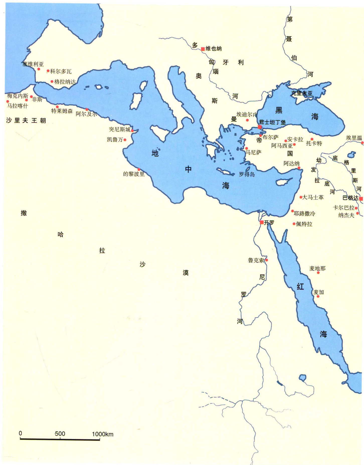
本卷中涉及的主要城市及建筑位置图（五、西部伊斯兰地区，1500~1800年）