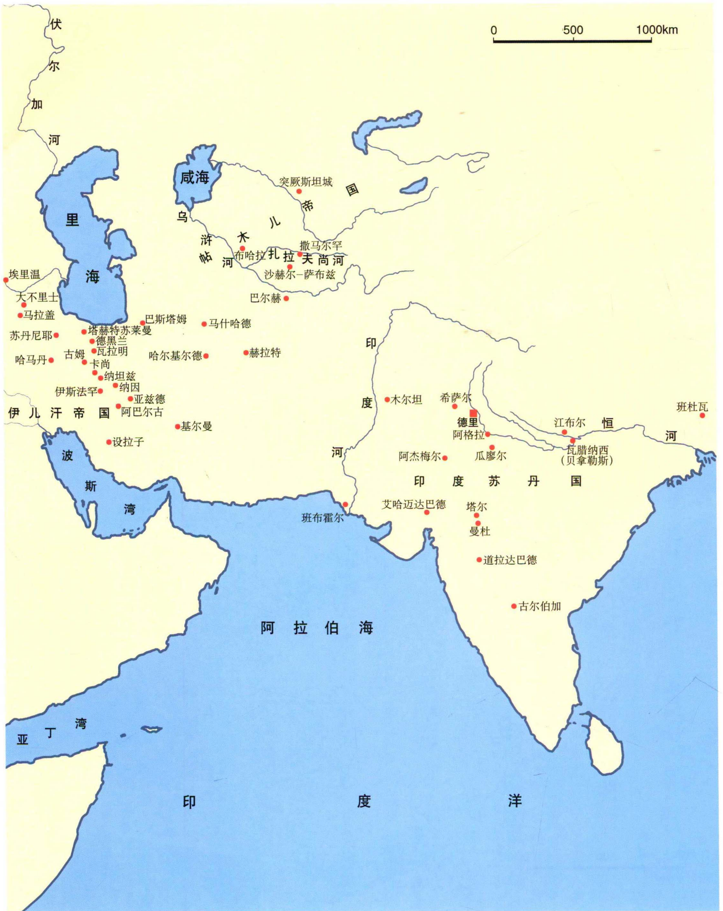
本卷中涉及的主要城市及建筑位置图（四、东部伊斯兰地区，1250~1500年）