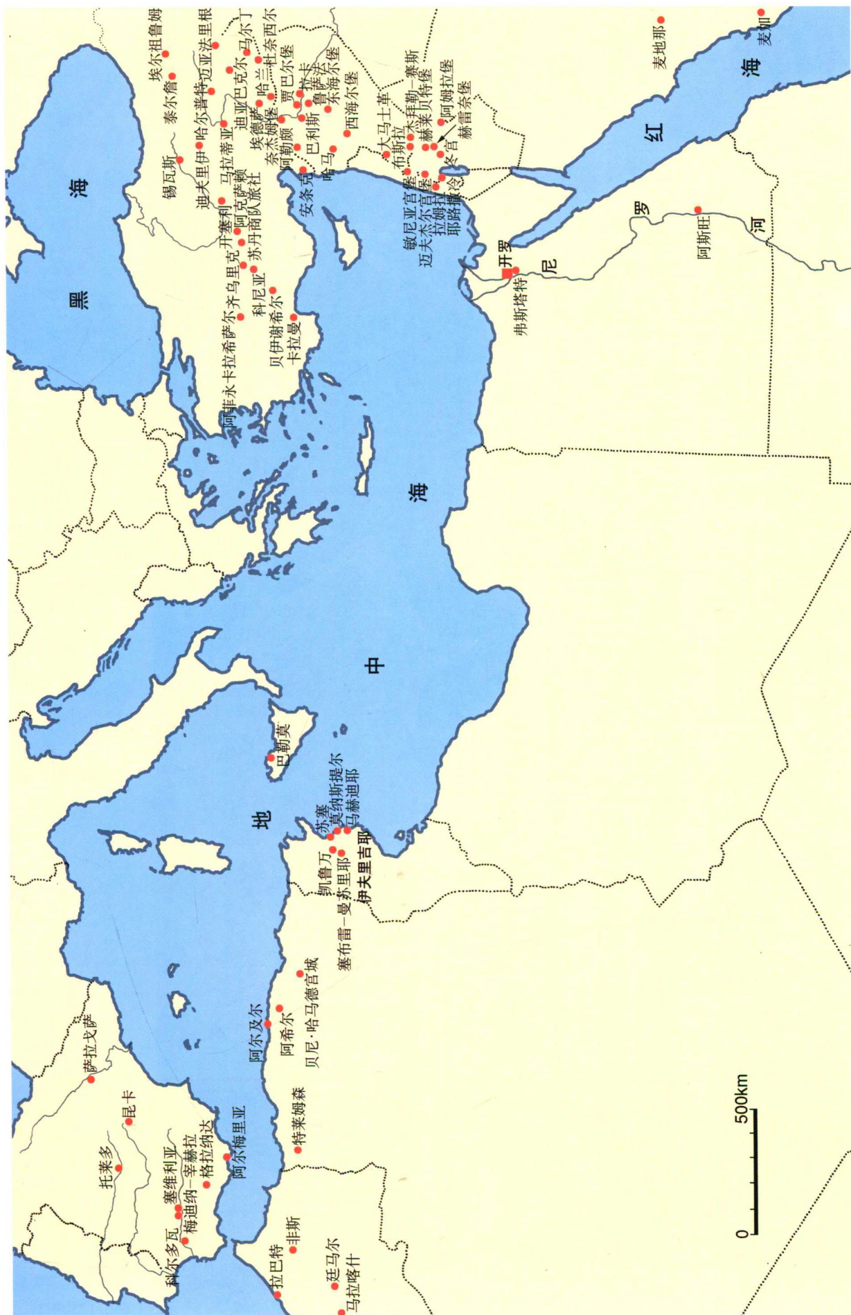
本卷中涉及的主要城市及建筑位置图(一、中部及西部伊斯兰地区, 650~1250年)