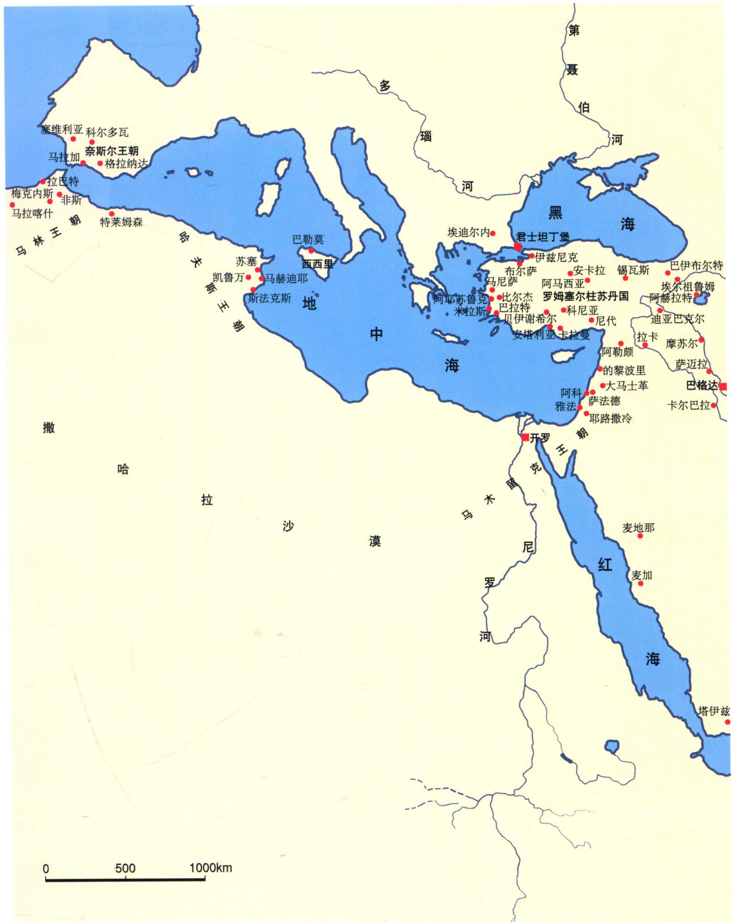
本卷中涉及的主要城市及建筑位置图（三、西部伊斯兰地区，1250~1500年）