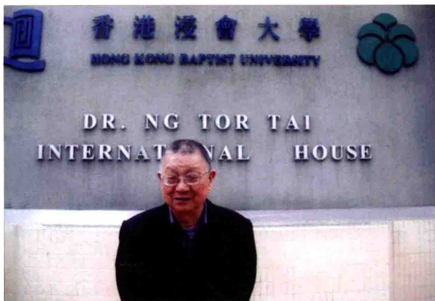
李今庸教授在香港浸会大学讲学期间留影