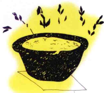
河北望都东汉墓壁画

汉代(公元前206年—公元220年)以壁画、石刻、画像砖等艺术形式著称于世,园艺事业开始兴旺,玩赏花木之风甚盛。河北望都东汉(公元25年—公元220年)墓道壁画中绘有一陶质圆盆,盆内均匀地立着六枝红花,甚似折枝花插入盆中,圆盆置于方形的几架上,形成花材、容器、几架三位一体的形象,当为中国插花艺术产生的初期形式。另外,现存于大英博物馆中的我国汉代陶盆,盆内有树、楼、鸭,以盆为大地,用象征的手法,在有限的空间里展现了大自然的美和生活的美。东汉末年,佛教从印度传入中国,插花成为佛事供奉物之一,出现了用瓶、盘水养插花的形式。