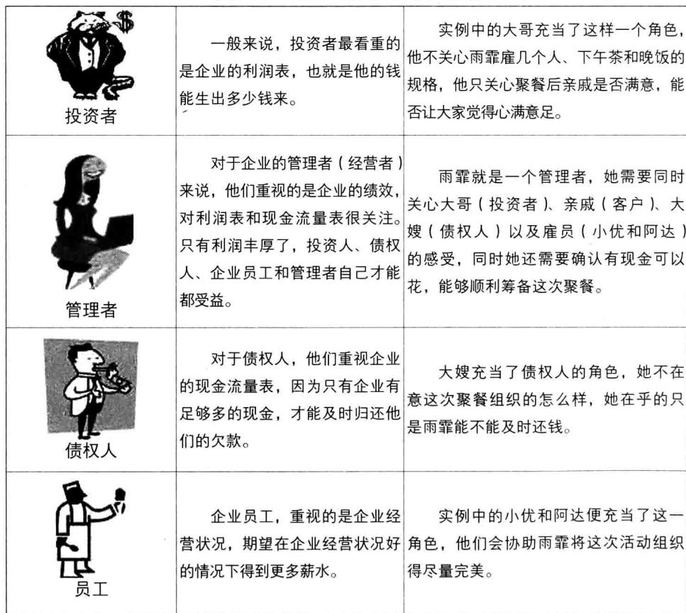
表1-1 哪些人需要懂财务报表

在财务报表的定义和组成中不难看出，财务报表包含的内容非常丰富。不同的报表使用者，其关注点是不一样的。下面对【实例1-1】中的各人物进行分析，说明哪些人需要懂财务报表，如表1-1所示。