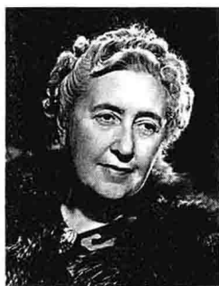
阿加莎·克里斯蒂 Agatha Christie (1890—1976)