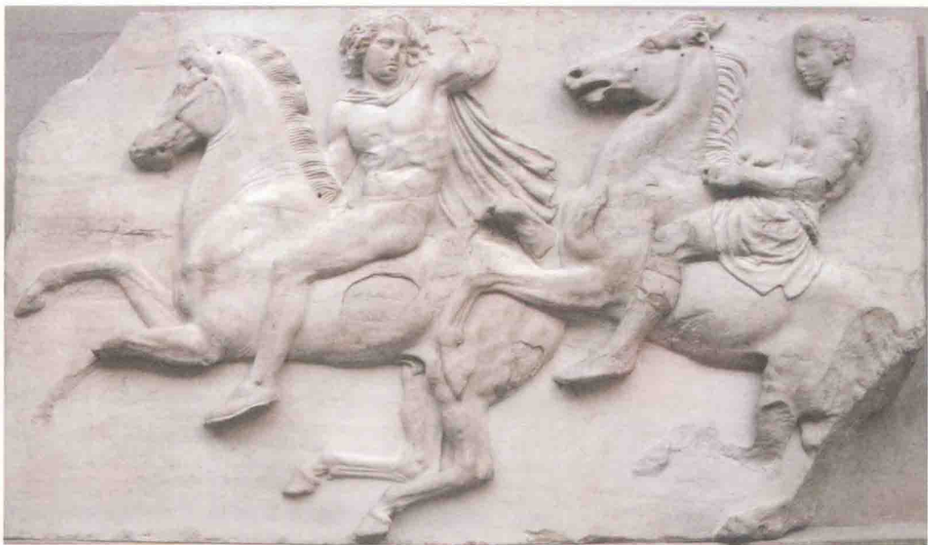
雅典帕提依神殿檐壁上的一幅雕刻。画面是两个英俊的年轻骑手。雕刻纪念雅典和希腊在马拉松战役中为击败波斯而浴血奋战阵亡的年轻士兵。

全体希腊联合舰队都集结在萨拉米海峡的东端，共有 366 艘三层桨座战舰和 7 艘 50 支桨战舰。大家对光凭这么点兵力就想打败波斯大军毫无信心。谣言四起，军心动荡。只有提米斯托克利斯力排众议，坚持和波斯海军决战。关于提米斯托克利斯其人，希腊历史学家修昔底德写道：“他显示出无比的天才，尤其是值此危急时刻……他是一个最好的决断者。而对于将来，他又是一个最好的预言家。他能用理论对实践经验加以解释。即使无经