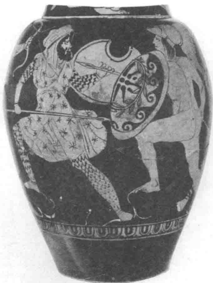
这是公元前5世纪中期雅典的酒坛。红色坛画描绘的是一名希腊士兵和一名波斯士兵交战的情景。战场上，按照风俗，希腊士兵赤身裸体，而波斯士兵则蓄须，穿着亚洲风格的衣服。

在温泉关战斗的同时，波、希海军在阿尔提米苏姆海峡上展开了大战。波斯海军统帅派出200艘腓尼基（地中海东岸的古国，约在今黎巴嫩和叙利亚的沿海一带。古代腓尼基人以航海、经商、包括贩运奴隶闻名）军舰南下，企图绕过优卑亚岛，截断希腊舰队退路。此时，一场狂烈的飓风扫过西爱琴海，毁掉了腓尼基舰队。这样，希腊舰队就可以集中力量来对付正面的波斯人。激战两天后，双方胜负难分。虽然希腊战舰质量上占优势，但波斯军舰数量很多，一时无法把他们击退。在晚