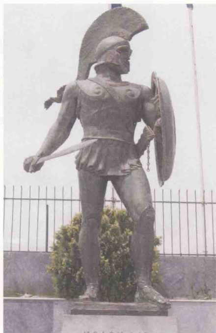
斯巴达武士的残缺雕像，雕刻的可能是著名的斯巴达王列奥尼达。

马拉松战役之后的 10 年间，希腊城邦陷入纷争和内乱，顾不上对付波斯人。只有雅典人接受了预言家提米斯托克利斯的忠告，用马罗尼亚银矿的收入建造了 150 艘三层桨