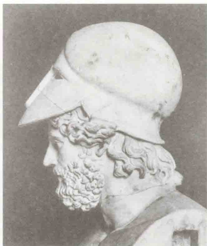
雅典海军统帅提米斯托克利斯雕像。