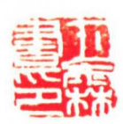
种德 55.5cm x 35cm