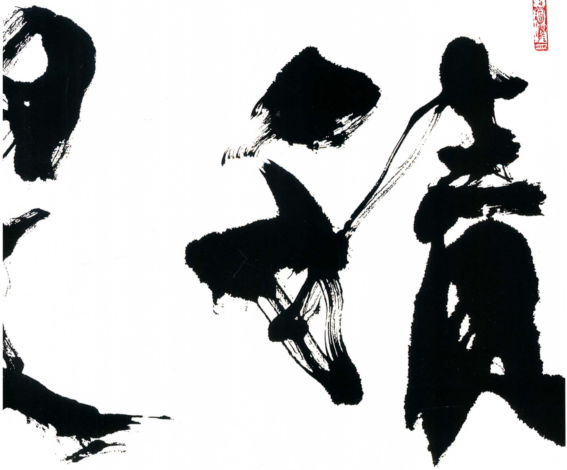
积翠堂 35cm × 71cm