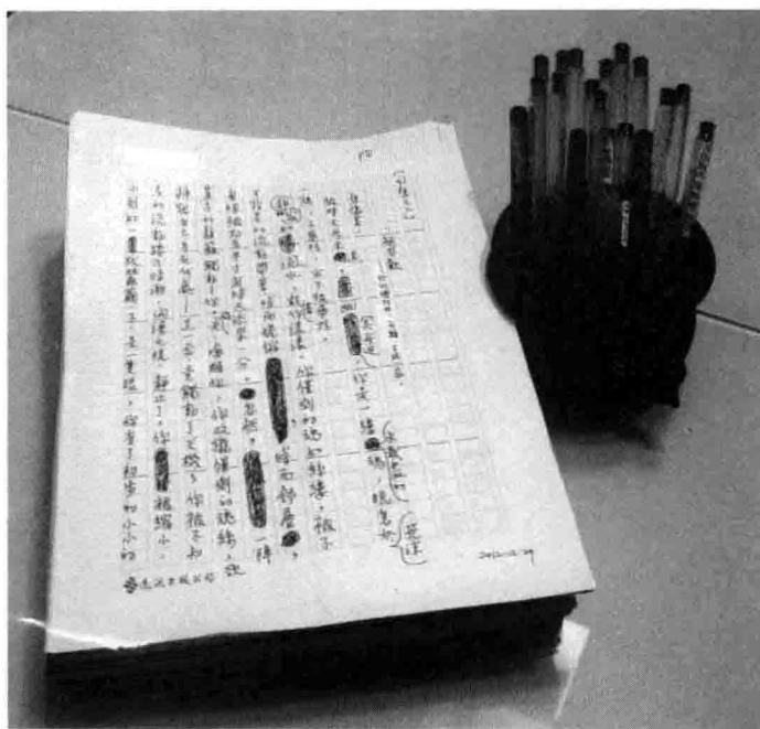
原稿及十八支写光了墨水的笔